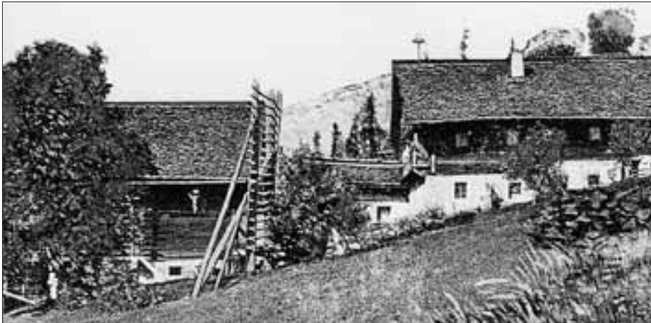
Der Eder-Hof, auf dem 1835 der Historienmaler Franz von Defregger zur Welt gekommen ist, in einer historischen Aufnahme aus den Jahren vor der Zerstörung durch eine Feuersbrunst (1934).

der: 1 Gulden, je 1 Mutt Weizen, Roggen und Gerste, 15 Vlg. Hafer, 1 Lamm, 1 Kas, 2 Hühner, 2 Schultern und 80 Eier.