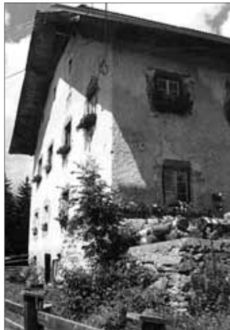
Der Plautzhof, höchster Bauernhof der Gemeinde in 1.325 m Seehöhe. Neben dem Gumpitsch- und dem Inner Wallensteiner-Hof zählt er zu den Erbhöfen der Gemeinde Iselsberg-Stronach.

12. Christian in der unteren Taber , 1/2 Hube, zinst der Kirche zu Gödnach 10 Solidi.