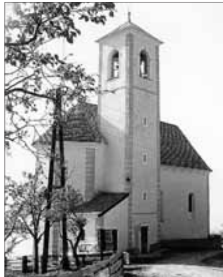
Die Kirche zum hl. Schutzengel am Iselsberg in einer Aufnahme von 1970, aus der Zeit vor der Restaurierung.

1759: Iselsberg erhält vom Consistorium in Salzburg die Baubewilligung. In diesem Jahr ist auch der Kirchenbau vollendet. Nun erhält man von Salzburg auch die Bewilligung, in dieser Kapelle Messe zu lesen, wenn sich die Nachbarschaft verpflichtet, diese Kirche ewig zu erhalten. (Verfachbuch Landgericht fol. 195)