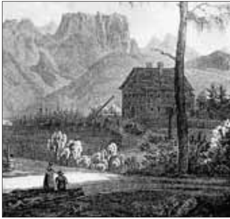
„GRENZE Zwischen Tyrol u. Kärnthen“, die Wacht mit Blick gegen die Lienzer Dolomiten; Lithographie von F. Wolf und B. de Ben, um 1840 (Ausschnitt).