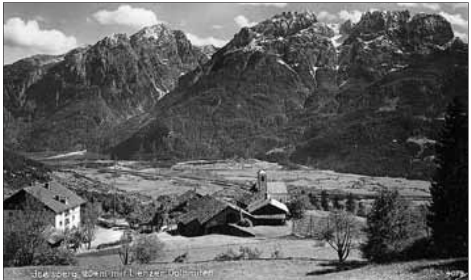
Blick auf die Ortschaft Iselsberg mit dem Schutzengel-Kirchlein mit Blick gegen die Lienzener Dolomiten; Aufnahme von 1938.

1. Christian Gumpitsch , Freistift der Herrschaft Lienz.