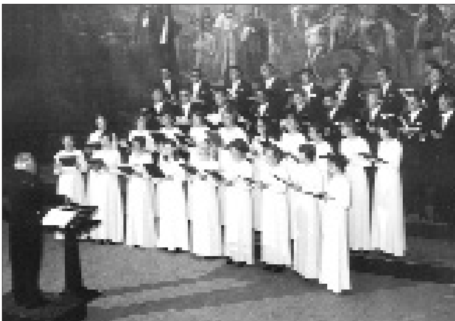
Vorstellung im Teatro Petrarca, Internationaler Chorwettbewerb Arezzo, 1975.

Nicht hingegen fehlte es der jungen Singgemeinschaft an Begeisterung und Durchsetzungsvermögen, um der neu entdeckten musikalischen Betätigung konsequent nachzugehen. Nach ersten, nicht ohne kritische Wachsamkeit zur Kenntnis genommenen, erfolgreichen Gesangsvorstellungen in und außerhalb Lienz, kam es am 3. März 1967 zum off. Eröffnungskonzert des Lienzer Kammerchores in der Aula des Lienzer Gymnasiums unter Darbietung der Johannespassion von Leonhard Lechner als Hauptwerk 4 . Mit dieser denkwürdigen Aufführung war der Öffentlichkeit eindrücklich vor Augen gestellt, daß der Kammerchor Lienz sehr wohl eine wesentliche Bereicherung der Lienzer Kulturszene vorzustellen vermochte. Ein Anspruch, der ohne Abstriche bis auf den heutigen Tag gehalten werden konnte, gleichgültig, ob das Publikum am jeweiligen Programmangebot nun größeren oder kleineren Gefallen fand.