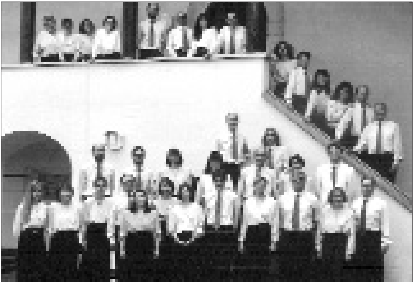
Kammerchor Lienz auf Schloß Bruck, 1993.