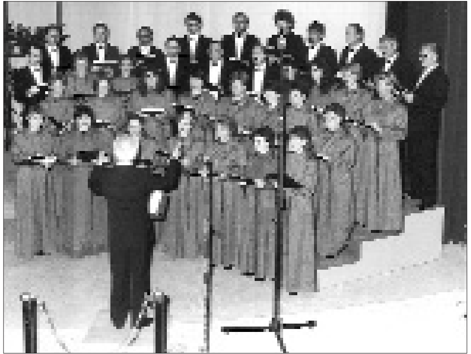
Chorfestival, Loreto (Italien), 1989. Im Teatro comunale.