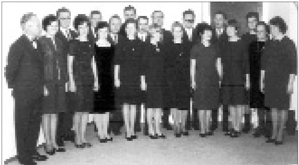
In der Städtischen Galerie (Probekolal), 1967.

Die eindrucksvolle Bestätigung seiner Leistungsfähigkeit auf internationalem Parkett bedeutete für den Kammerchor Lienz nicht etwa selbstgefälliges Verharren auf dem Erreichten, sondern vielmehr Verpflichtung und Antrieb, die erbrachte musikalische Reife zu festigen und zu halten. Motivation, Vielfalt in der Werkauswahl, Beweglichkeit im Aufführungsangebot und Aufgeschlossenheit gegenüber allen, der gehobenen Chormusik verhafteten