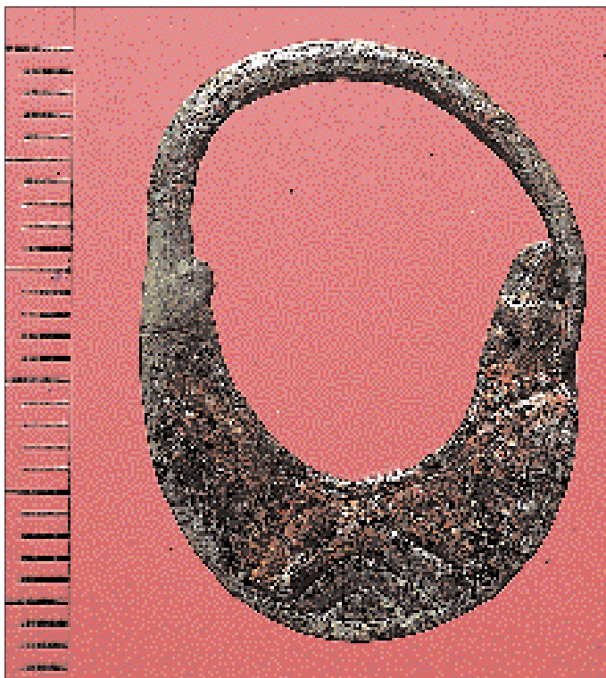
Abb. 5: Ohrring der Stufe Köttlach 2 (8. bis 11. Jh.)

Beifunde, mit deren Hilfe die Zeit der Errichtung und des Umbaus der Kirche C absolut bestimmt werden könnten, fehlen. Ein Vergleich der neu ausgegrabenen Kirche C mit den beiden anderen frühchristlichen Kirchen A und B am Kirchbichl ermöglicht unter Umständen die Erstellung einer relativen Chronologie. Geht man von einer festen Verbindung von Priesterbankgröße und Größe des an einer Messe teilnehmenden Klerus aus, dann dürften die neu entdeckte Kirche C und die sog. „Bischofskirche, Phase 1“ (Kurzbezeichnung: Kirche A1) etwa gleichzeitig entstanden sein. Der innere Umfang beider Priesterbänke beträgt im Fundamentbereich ca. 4,70 m. Außerdem fehlt bei beiden Priesterbänken ein erhöhter Mittelsitz für den Gemeindevorstand. Die Priesterbank der Kirche A1 ist in einer zweiten Phase von einer deutlich größeren mit Kathedra überbaut worden (innerer Umfang im Fundamentbereich: 8,50 m). Eine Priesterbank selben Aus-