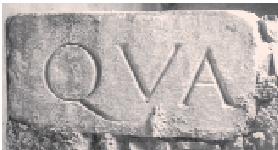
Abb. 3: Römischer Inschriftenstein (1. Jh. n. Chr.)

Wenden wir uns erneut der Frage nach der Errichtungszeit von Kirche C zu, dann erweist sich ein Blick auf die „Bischofskirche“ von Teurnia/St. Peter im Holz als besonders nützlich. Der Grundriß dieser Kirche, deren erste Phase mittels Beifunden in die erste Hälfte des 5. Jhs. datiert werden konnte 12 , erinnert stark an den von Kirche C. Trotz der öfters nachgewiesenen Gefährlichkeit derartiger Grundrißvergleiche scheint in