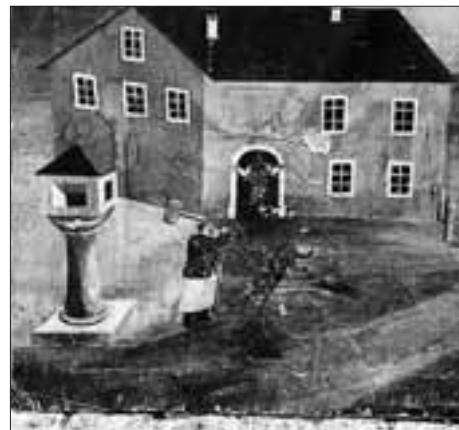
Szene beim Lienzner Siechenhaus.

Indes waren neue Gerüchte aufgetaucht, die die Mißstimmung in der Bevölkerung zur Spitze trieben: Den Urheber der ganzen Misere und Erstverscharrten habe ein wenig ehrenhafter Zeitgenosse nächtlicherweile ausgegraben und ihm das Fell abgezogen, wohl um es für ein paar lumpige Kreuzer zu verschachern. Auch habe der tollwütige, fremde Hund in der Stadt eine Kuh angefallen und gebissen; man könne nicht wissen, was daraus werde. Solche und ähnliche, hier nicht nachvollziehbare Reden und Vorkommnisse bildeten mit den obgeschilderten, wahrlich bedauernswerten Geschehnissen für Wochen das Tagesgespräch. Kein Wunder, daß die