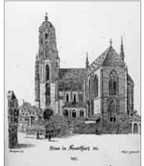
Der Dom St. Bartholomäus zu Frankfurt a. M.; Kupferstich des Außerferner Künstlers Anton Falger nach einer Zeichnung von Domenico Quaglio, um 1840.