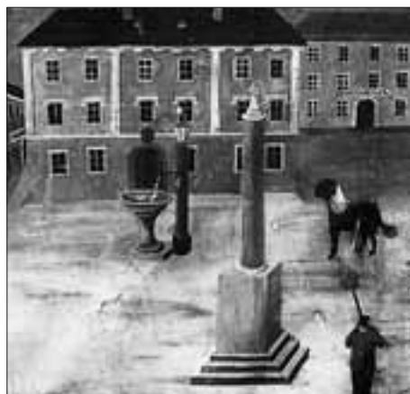
Der tollwütige Hund am Johannesplatz.

Man kann sich vorstellen, welch Aufschrei der Entrüstung durch die Reihe der Hundebesitzer und -liebhaber ging, als das große Gemetzel begann, das ihre lieben Vierbeiner das Leben kostete: Ein Schuljunge wurde gedungen, die einzeln oder in einer Umzäunung verwahrten „Todeskandidaten“ zu erschießen. Den Schlechtgetroffenen erging es dabei noch schlimmer, denn beigesprungene Helfer vollendeten mit Hämmern, Hacken und Schlägeln das traurige Werk.