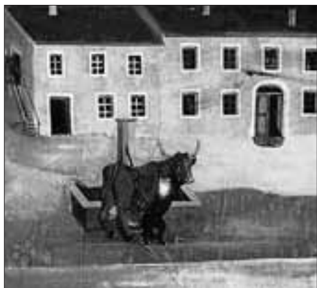
Ein tollwütiger Hund fällt in der Stadt Lienz eine Kuh an; Ausschnitt aus der Moritatentafel.

Das am 22. Feber 1886 im Stadtgebiet aufgetauchte, wutverdächtige Tier konnte am Folgetag am „obern Stadtplatz“ (= Johannesplatz) durch einen gezielten