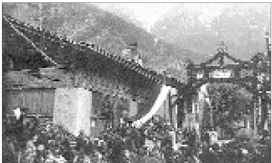
Von der Wirtsveranda bis zum Gaßlerhaus spannt sich der Triumphbogen.

Jetzt galt bei den meisten die Losung: Nachdem wir Gott gelobt haben, wollen wir den Magen laben! Es erfolgte geradezu ein Sturm auf Rienzners Gasthof. Die Festgäste und alle Gemeindemitglieder hatten freie Bewirtung auf Gemeindekosten. Man hoffe, daß dies weder mißbraucht noch boshaft dahin ausgelegt werde, als ob man an Geldüberfluß leide; sondern man wollte, weil die freie Bewirtung auf jeden Fall stark auszu-