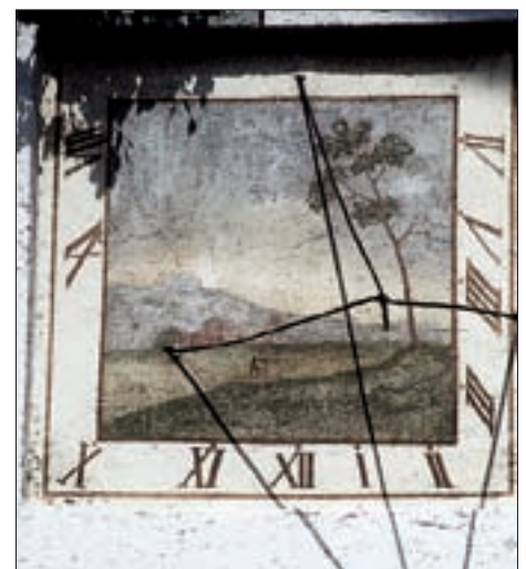
Oberlienz, „Angstinger“-Hof, Sonnenuhr von 1810.

In den 90er-Jahren fand man bei Restaurierungsarbeiten am Kirchenschiff der Pfarrkirche zum Hl. Ulrich in Obertilliach eine sehr interessante Sonnenuhr aus dem