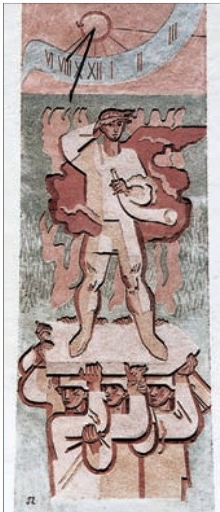
Lienz, Innenhof von Schloß Bruck, Sonnenuhr („Roland“, 1944) mit symbolischer Darstellung des Großdeutschen Reiches; Sgraffito des steirischen Künstlers Rudolf Szyszkowitz (im öffentlichen Auftrag), 405 x 146 cm (Gesamtdarstellung), 79 x 146 cm (Sonnenuhr). – Die Darstellung ist bezeichnend für die Zeit der Adaptierung von Schloß Bruck als Museum.

Ein ähnliches „Experiment“, nämlich die Umrechnung der wahren Ortszeit in die Mitteleuropäische Zeit, habe ich mit der Konstruktion und Gestaltung der Sonnen-