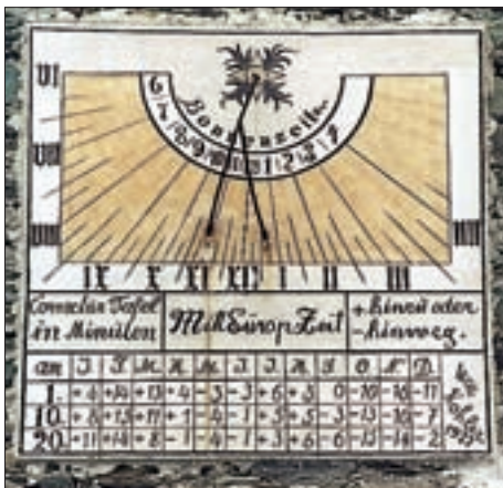
Prägraten-Hinterbichl, Kapelle zu den Hll. Chrysanth und Sebastian, Sonnenuhr konstruiert von Willi Kohler, 1922.