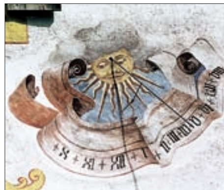
Assling-Mittewald – Haus Nr. 1, ehemaliger Gasthof „Zur Alten Post“, Sonnenuhr 18. Jahrhundert.

Im Jahre 1894 kam es weltweit zur Einführung der Zonenzeiten. Ausgangspunkt für dieses Zeitmaß ist der Meridian durch Greenwich. Von diesem Nullmeridian ausgehend werden weitere Zonenzeiten für die Meridiane, die durch 15 teilbar sind, definiert. Für den Großteil von Europa gilt seither die mittlere Ortszeit der Orte am 15. Längengrad östlich von Greenwich als Gebrauchszeit. Man nennt sie Mitteleuropäi-