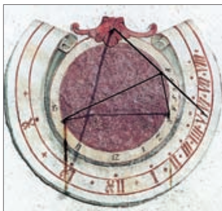
Matrei i. O., Hintermarkt 6, ehemaliger Ansitz Lasser von Zollheim, Sonnenuhr von 1571 (?).

Der neue Sonnenuhrentyp ist heute noch gebräuchlich. Sein Charakteristikum ist der erdachsparelle Stab (auch Polstab ge-