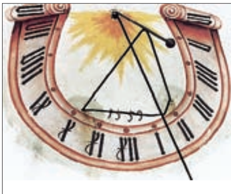
Nußdorf, Ansitz „Staudach“, datierte Sonnenuhr von 1559.