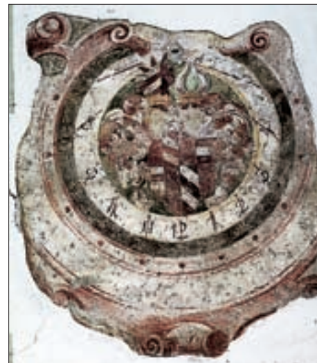
Lienz, Beda Weber-Gasse 4, Sonnenuhr 17. Jahrhundert.

Eine seiner vielen wissenschaftlichen Beschäftigungen war auch die Konstruktion und der Bau von Wand- und tragbaren Sonnenuhren. Seine wahrscheinlich erste Sonnenuhr ist jene am Brangerhof in Unterperffuss, die mit 1745 datiert ist. Diese Uhr konstruierte und malte er sogar noch vor seiner Lehrzeit bei Pater Weinhart. Wie er es zustande brachte, eine Sonnenuhr mit Datumslinien sowie mit einem Mittelband für die Tageslängen zu konstruieren auf der Grundlage einer einfachen Dorfschulaus-