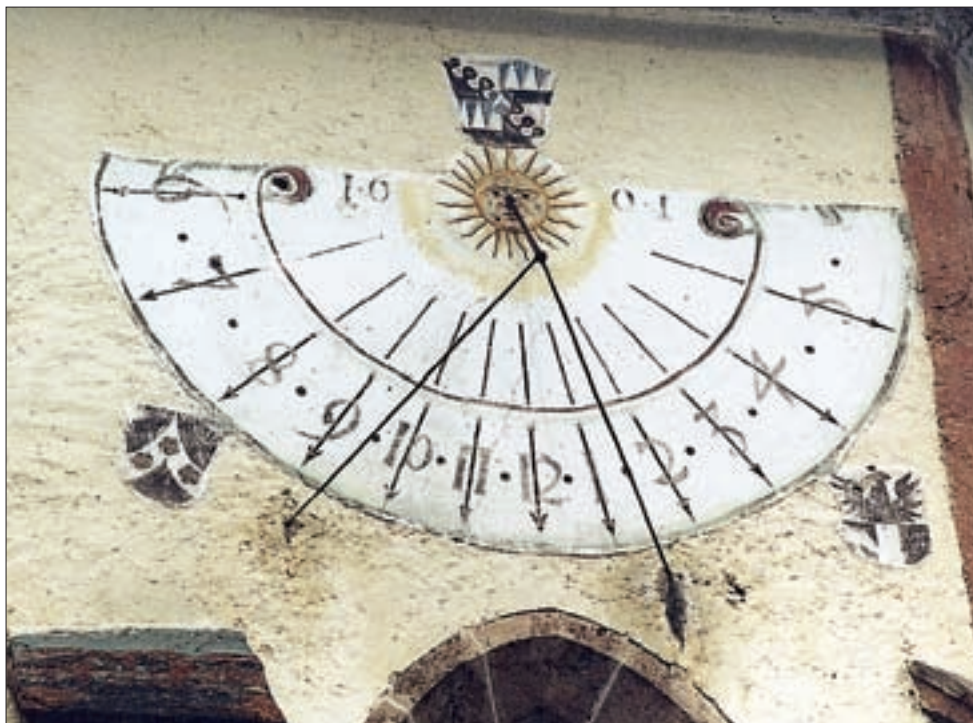
Virgen, Wallfahrtskirche Obermauern, datierte Sonnenuhr von 1601.

Griechen, die mittels des Gnomons die ersten Sonnenuhren für die Messung der Tagesstunden konstruierten. Von der Antike bis ins Mittelalter wurden der „lichte Tag“, also die Zeitspanne von Sonnenauf- bis Sonnenuntergang, sowie die Nacht in jeweils zwölf Abschnitte geteilt. Da die Länge dieser Zeitspannen von der Jahreszeit abhängig ist, ergaben sich im Laufe des Jahres ungleich lange Tag- und Nachtstunden. Man nennt sie daher temporale Stunden.