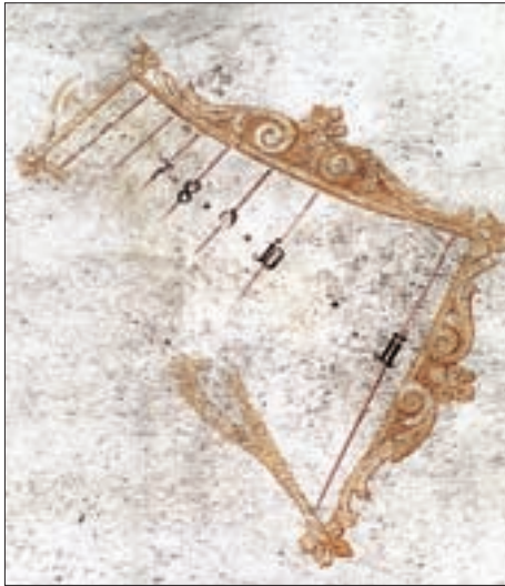
Lienz, Tammerburg, bei der Fassadenrestaurierung 1999 neu aufgetauchte Sonnenuhr, zweite Hälfte 17. Jahrhundert.

bildung, ist schwer erklärbar. Offenbar war er in der Lage, sich auch nur aus Büchern Wissen beizubringen. Es sind heute von Peter Anich neun Wandsonnenuhren erhalten. Sie gehören zu den sehenswertesten Tirols. Nach seinem Tod hat man noch viele Jahrzehnte seinen Sonnenuhrenstil nachgeahmt.