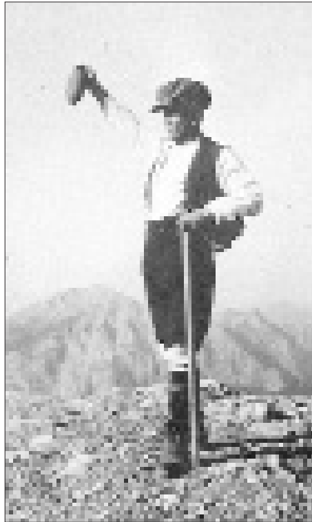
Abb. 6: Auf dem Weg zum Venediger, etwa an der Stelle des ehemaligen Gumpbachkreuzes, am 5.10.1929.

papst« mit 132 Großvenedigerbesteigungen, nicht wesentlich. 33