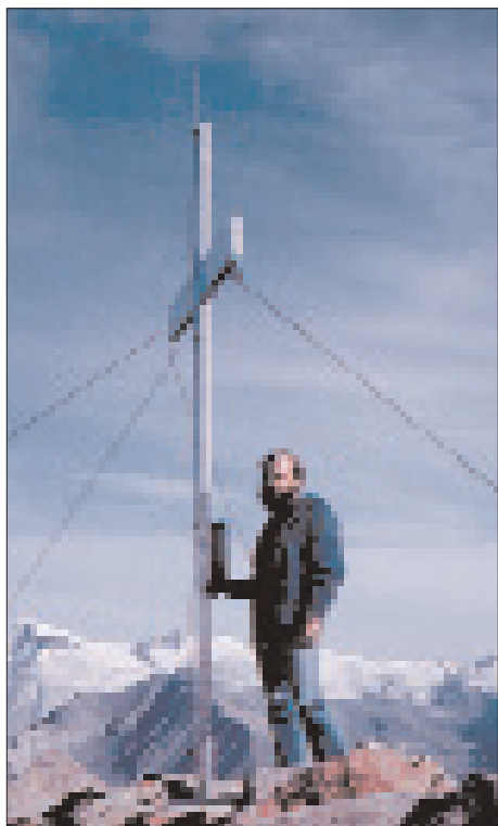
Abb. 12: Am Gipfel des Lasörling (3098 m). Im Hintergrund der Großvenediger und das Rainerhorn, am 21.9.1985.