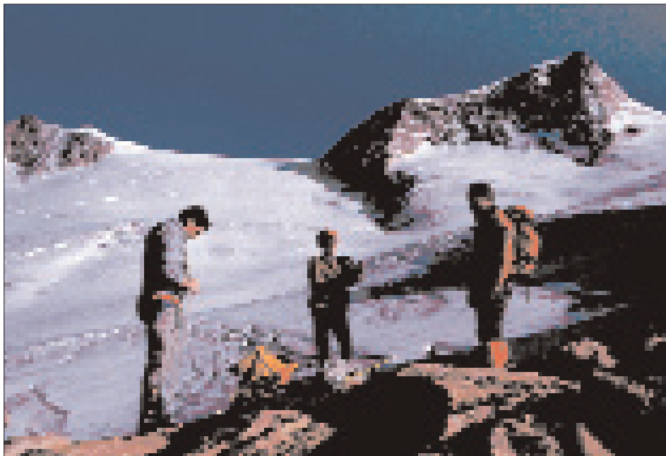
Abb. 13: Vorbereitungen am Mullwitz-Adlerl zur Durchquerung des Mullwitz-Kees auf dem Weg zum Großvenediger (6.9.1986).

pflgte er selbst in großen Höhen mit beiden Beinen auf der Erde zu stehen, ohne sich selbst zu verstecken, sondern ganz einfach der „Resinger“ zu bleiben. In den Bergen war er nämlich souverän, ganz besonders am Venediger, wo er keinen Respekt vor nichts und niemandem kannte, auch nicht vor einem Bischof. Ihm – wahrscheinlich handelte es sich um Bischof Sigmund Waitz – soll er nach einem schweißtreibenden Anstieg zum Venediger statt eines Glückwunsches zum Gipfelsieg lediglich gesagt haben: „Bischof, Du stinkst!“ 60