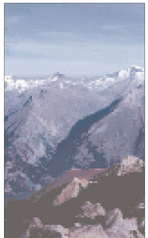
Abb. 11: Das Dorfer-Tal - der kürzeste Weg zum Großvenediger im Hintergrund (vom Lasörling-Gipfel, am 21.9.1986).