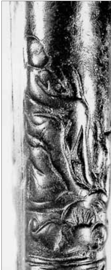
Abb. 4: Detailaufnahme mit der Darstellung eines Hirten.

Hirten und Figuren aus dem bacchanalischen Themenkreis würden auf eine Fruchtbarkeits-Symbolik der Darstellungen hinweisen. Die Fruchtbarkeit der Acker und der Haustiere ist in der bäuerlichen Umgebung lebenswichtig. Sie wurde