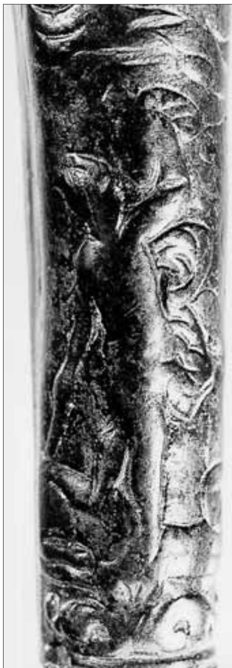
Abb. 2: Detailaufnahme mit der Darstellung der tänzelnden Figur.

sein. Ihr rechter Arm weist nach unten und hält einen Stock. Der linke Arm ist mit einem nicht näher bestimmbareren Gegenstand in der Hand über den Kopf erhoben. Die Deutung dieser Figur muß offen bleiben. Wurde hier eine Mänade mit Trommel dargestellt oder der Wein- und Fruchtbarkeitsgott Dionysos/Bacchus 4 mit Weintraube und Stab? Oder handelt es