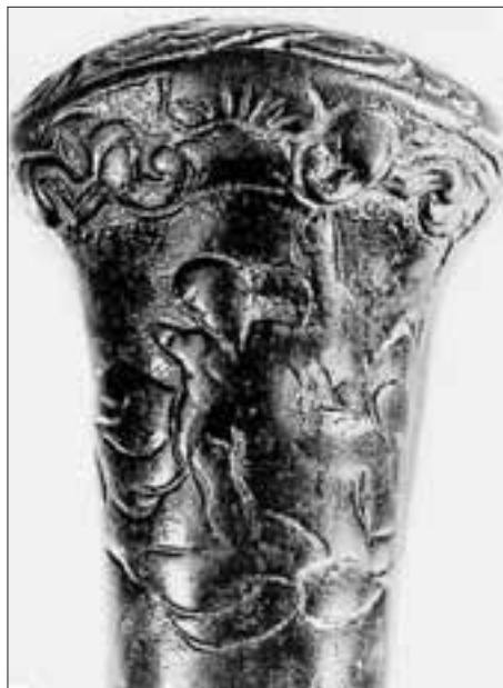
Abb. 1: Detailaufnahme mit der sitzenden Figur in den Wolken oder Felsen.

Der Griff besteht aus zwei gegossenen, figürlich verzierten Schalen. Der Hohlraum im Inneren dürfte durch einen Holzkern ausgefüllt gewesen sein, in den der eiserne Klinglefortsatz eingebettet war. Das Holz ist in einem sehr schlechten Erhaltungszustand, Teile davon fehlen oder bewegen sich lose im Inneren. Der Quer-