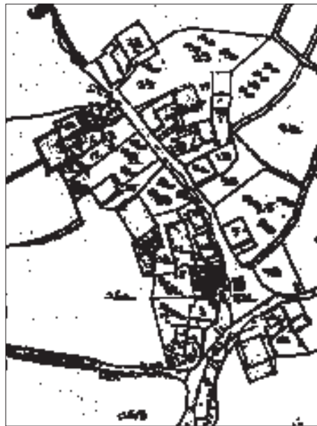
Das Taxer- und Krameranwesen (waagrecht schraffiert) auf dem Kataster von 1859.