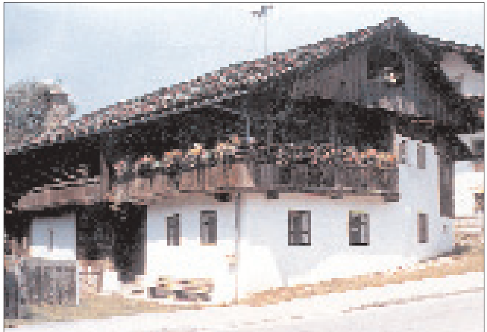
Das Taxeranwesen (links) mit angebautem Kramer-Haus in Patriasdorf; Aufnahme von Südosten.