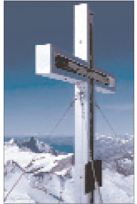
Abb. 15: Das Gipfelkreuz am Großvenediger Richtung Süden (6. 9. 1986).