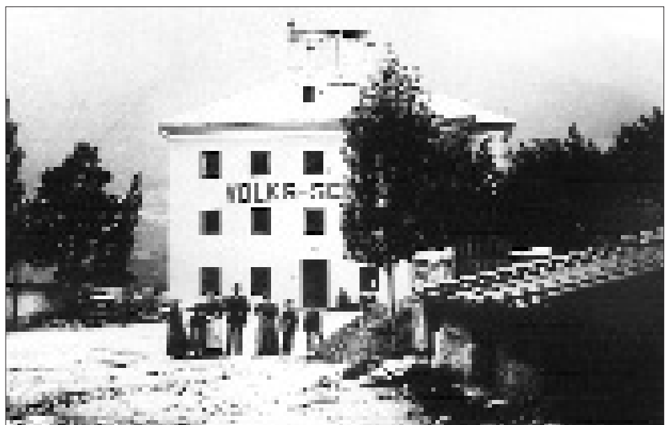
Das 1853 bis 1856 errichtete neue Matreier Schulhaus an der Südseite des Kirchplatzes.