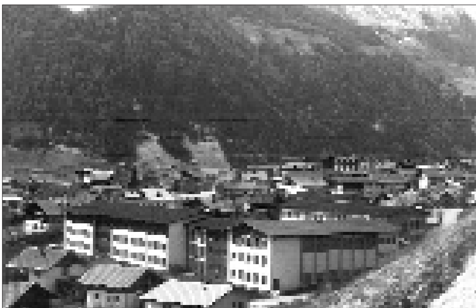
Das moderne Matreier Schulzentrum. Die Volksschule wurde am 16. September 1961, die Hauptschule am 19. Jänner 1971 eingeweiht.

K.k. Schuldistrikt Inspektion Windisch Matrei, 6. November 1854 Johann P. Wierer, Schuldistrikt-Inspektor