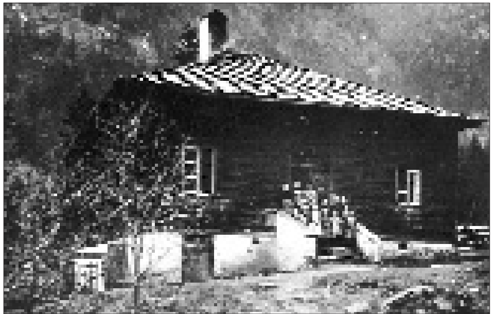
Schulhaus in der Ortschaft Feld der Gemeinde Matrei i. O., erbaut um 1800, abgebrannt im Jahr 1932.

Es wäre sehr zu wünschen, daß das ganze weltliche Schulpersonal dieses Distriktes, welches durchaus karg besoldet ist, eine bessere Dotierung ständig erhalten könnte. Die Besoldung manches Lehrers wirft nicht soviel ab, daß es in der Kost bei diesen teuren Zeiten versorgt wäre. Daher machen mehrere Lehrer und Gehilfen Miene, den Schuldienst nicht mehr länger fortzusetzen, wenn keine bessere Besoldung erzielt werden sollte. Es