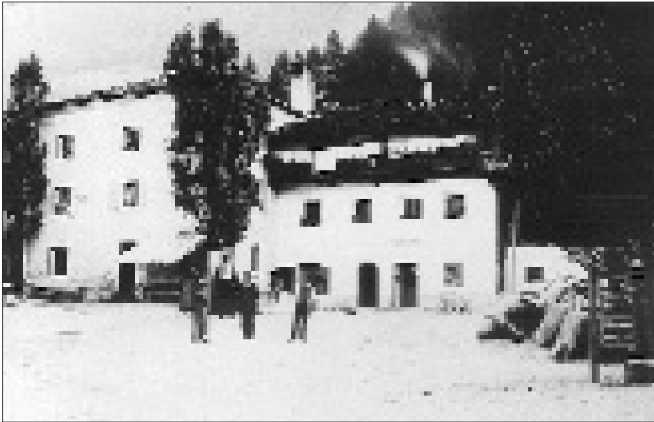
Das erste Matreier Schulhaus (Hofen-Haus) an der Nordseite des Kirchplatzes; es stammt vermutlich aus dem 18. Jahrhundert. Aufnahme von 1897.