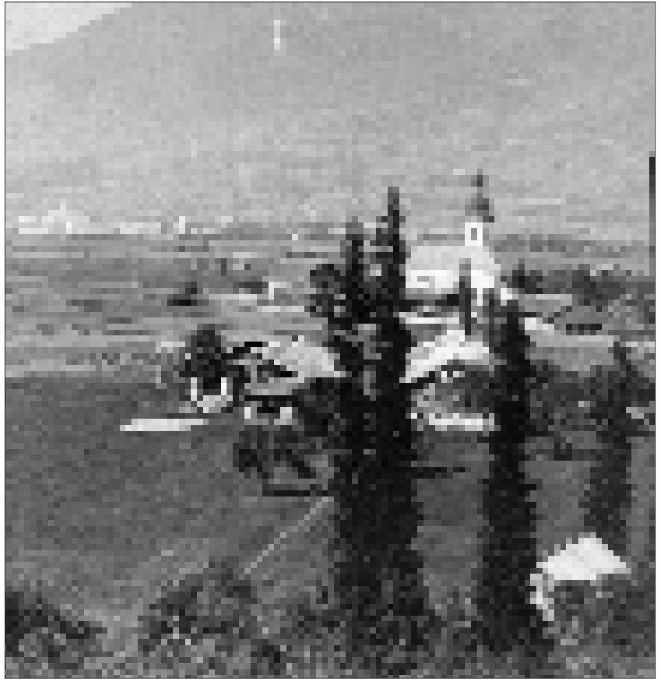
Blick auf das Ortszentrum von Tristach, um 1880. Als Besonderheit zeigt die Aufnahme noch die barocke Zwiebelhaube des Kirchturms, die 1898 durch einen Brand zerstört und in der Folge als gotisierender Spitzhelm wieder aufgebaut worden ist.