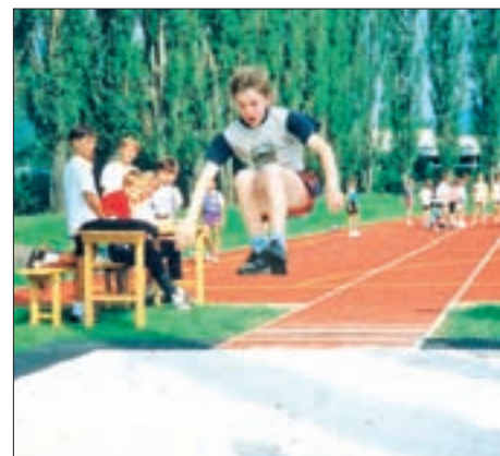
▲ Bezirksschulsportfest aus Anlass der Fertigstellung der Leichtathletikanlage im Dolomitenstadion; 26. Juni 1992.