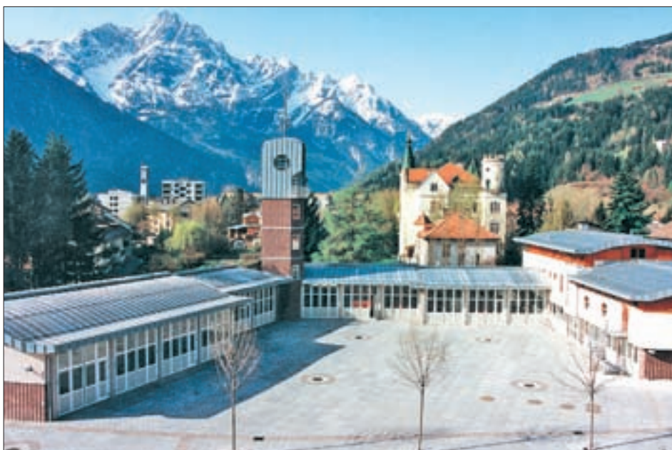
Die neue Feuerwehrzentrale in der Lienzer Dolomitenstraße entspricht modernsten Anforderungen; sie wurde am 16. Mai 1992 eingeweiht.

Im Bereich des Städtischen Friedhofs werden die Neugestaltung (Arch. Dipl.-Ing. Gerhard Gussnig) der Aufbahrungs-