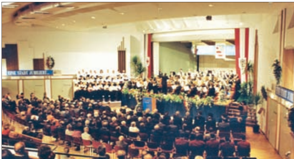
Der 1970 eröffnete Stadtsaal dient vielen Kulturveranstaltungen als idealer Rahmen; im Bild die Festveranstaltung „750 Jahre Stadt Lienz“ am 22. Februar 1992.