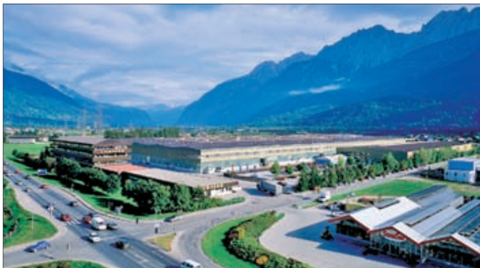
Blick auf das Liebherr-Werk, das im Jänner 1981 die Produktion von Kühlgeräten aller Art aufgenommen hat. Es ist der größte Industriebetrieb im Bezirk Lienz; Aufnahme von 1999.

meister Hubert Huber immer bereit, die Niederlassung von gewerblichen und industriellen Betrieben vorwiegend im Stadtteil Peggetz bzw. in der Bürgerau zu fördern, wodurch die Arbeitsmarktlage für ganz Osttirol wesentlich verbessert wird.