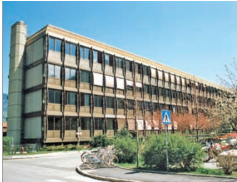
◀ Das Schulzentrum mit der Bundeshandelsakademie als Mittelpunkt wurde 1980 eröffnet; Aufnahme von 1989.

Vorher schon eingeleitet, nimmt Lienz in der Amtszeit von Bürgermeister Hubert Huber einen kontinuierlichen Aufschwung als Schulstadt, wobei die rechtlichen Träger der Bildungsinstitutionen teils das Land Tirol oder der Bund sind. Aber nahezu alle Schulen erhalten durch Finanzierung bzw. auf Betreiben der Stadtgemeinde Neubauten, oder sie werden einer gründlichen Renovierung unterzogen, wofür der Um- und Zubau des Bundes-Oberstufenrealgymnasiums (BORG) im ehemaligen Spitalsgebäude das beste Beispiel darstellt. Durch Vorfinanzierung durch die Stadtgemeinde Lienz können die notwendigen Bauarbeiten viel früher eingeleitet und bereits 1992 abgeschlossen werden. Die Planung ist wieder Architekt Mag. arch. Dieter Tuscher übertragen worden. Damit wird nicht nur ein zweckentsprechender Schulbau geschaffen, sondern zugleich ein historisches Gebäude, das mit der Geschichte der Stadt auf das engste verbunden ist, erhalten. Aus denkmalpflegerischer Sicht von hoher Bedeutung ist die Revitalisierung des Bereichs östlich der Spitalkirche mit der historischen Stadtmauer und der Kirche selbst. – Neben der Errichtung der Volksschule Nord (1967/70), der Sonderschule (1977/79), einer zweiten Hauptschule ist die Schaf-