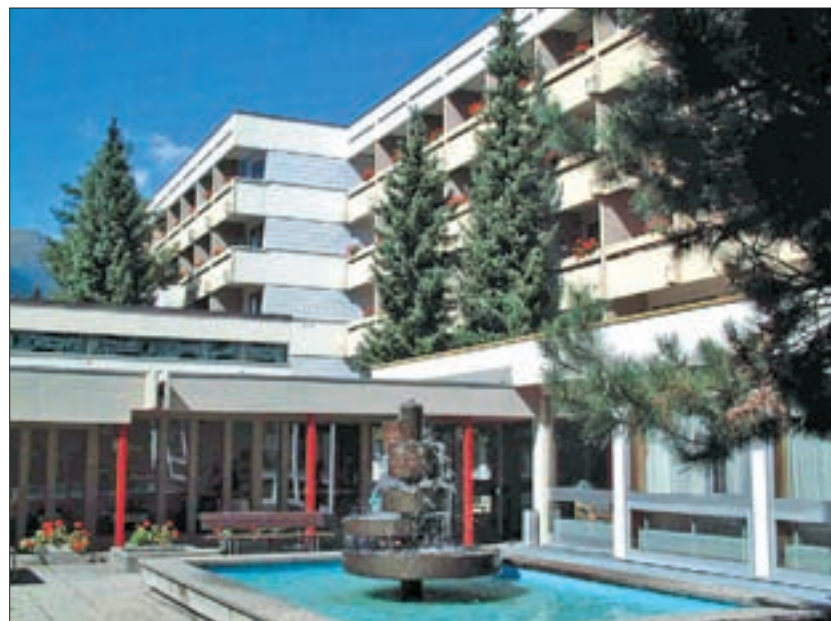
Das Lienzener Bezirksaltenheim, das 1971 bezogen und inzwischen erweitert worden ist; Aufnahme des Eingangsbereichs von 2001.

Lienz stattfindet, der Bau der Transalpinen Ölleitung Triest-Ingolstadt, ebenfalls 1967 in Betrieb genommen und die Elektrifizierung der Bahnstrecke Spittal an der Drau –