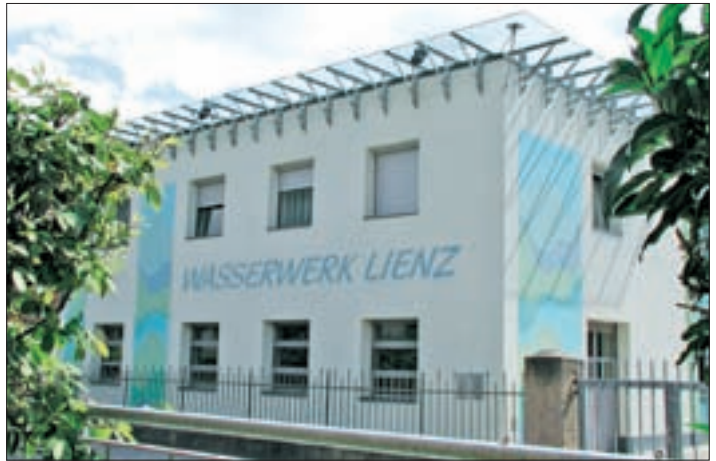
▲ Nach der Erweiterung der Trinkwasserversorgungsanlage wurde in den Jahren 1979/80 das städtische Wasserwerk erneuert. ◀ Das Klärwerk Lienzer Talboden, das 1984 den Betrieb aufgenommen hat und inzwischen erweitert worden ist; Aufnahme von 2003.

„Abwasserverbandes Lienzer Talboden“ (1977). Das regionale Klärwerk Lienzer Talboden als unbedingt notwendige Umweltschutzeinrichtung nimmt Ende Oktober 1984 seinen Betrieb auf. Es ist für 25.000 Einwohnergleichwerte ausgelegt, kann aber bei Bedarf auf das Doppelte erweitert werden, womit das Abwasserproblem für lange Zeit erledigt ist. Durch diese Umweltmaßnahme wird die Drau wieder zu einem sauberen Fluss.