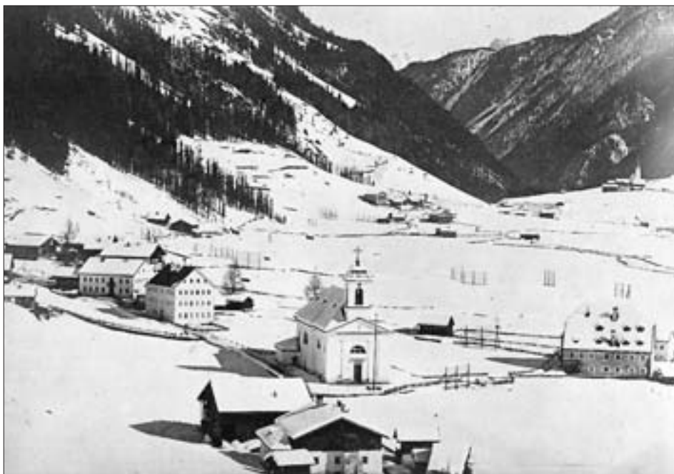
St. Jakob um 1900. Rechts von der Pfarrkirche das Handelshaus, ehemaliges Verwaltungszentrum der Bergwerke, links von der Kirche das alte gemauerte Schulhaus (vorne). Es wurde 1888 erbaut und 1999 abgerissen.