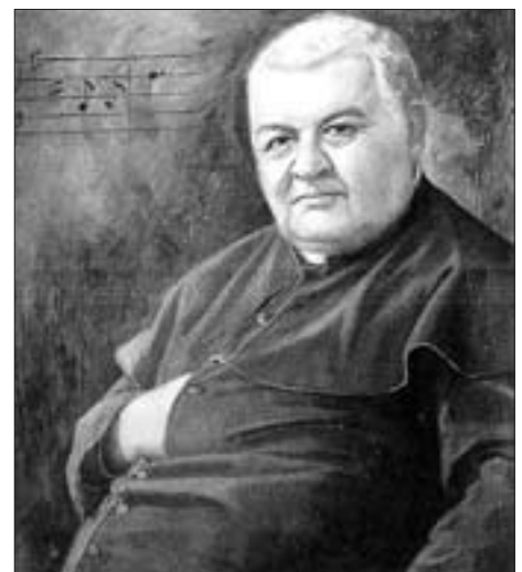
▲ Ignaz Mitterer leitete den Brixner Domchor; als Franz Unterkircher die Schule besuchte. Gemälde von Johann Baptist Oberkofler (Abbildung mit freundlicher Genehmigung des Verlages Tyrolia).