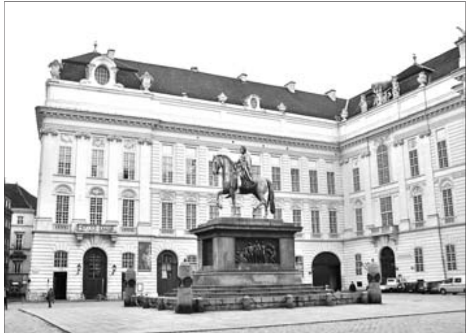
Die Handschriftenabteilung der Österreichischen Nationalbibliothek in Wien am Josefsplatz.

Zeit seines Lebens blieb Unterkircher den „Osttiroler Heimatblättern“ verbunden,