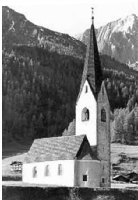
Die Fialkirche St. Georg in Kals a. Gr.

Entsprechend der späten Hinzufügung der Legende vom Drachenkampf, kommen solche Darstellungen im deutschen Sprachraum erst im 13. Jahrhundert vor. Vorher ist die Darstellungsart lange Zeit von der byzantinischen Kunst beeinflusst. Zunächst waren ausschließlich das Bildnis in Friedenstracht, meistens mit Märtyrerpalme, und als jugendlicher Ritter mit Lanze üblich. – Beide Sujets findet man z. B. in der von Kals nicht allzu weit entfernten romanischen Kirche St. Nikolaus in Matrei i. O. 11 in der oberen Kapelle des Chorturms (St. Georgs-Kapelle) aus dem dritten Viertel des 13. Jahrhunderts und auf der westlichen Außenseite im Rahmen des