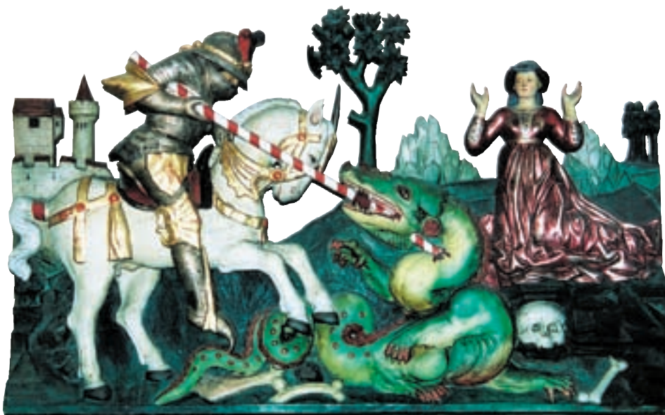
Spätgotisches St. Georg-Relief des ehemaligen Kaiser Flügelaltars, als Kopie der zweiten Hälfte des 19. Jahrhunderts überliefert.

cher gesehen 20 , nur Erich Egg schreibt sie Simon von Taisten zu 21 .