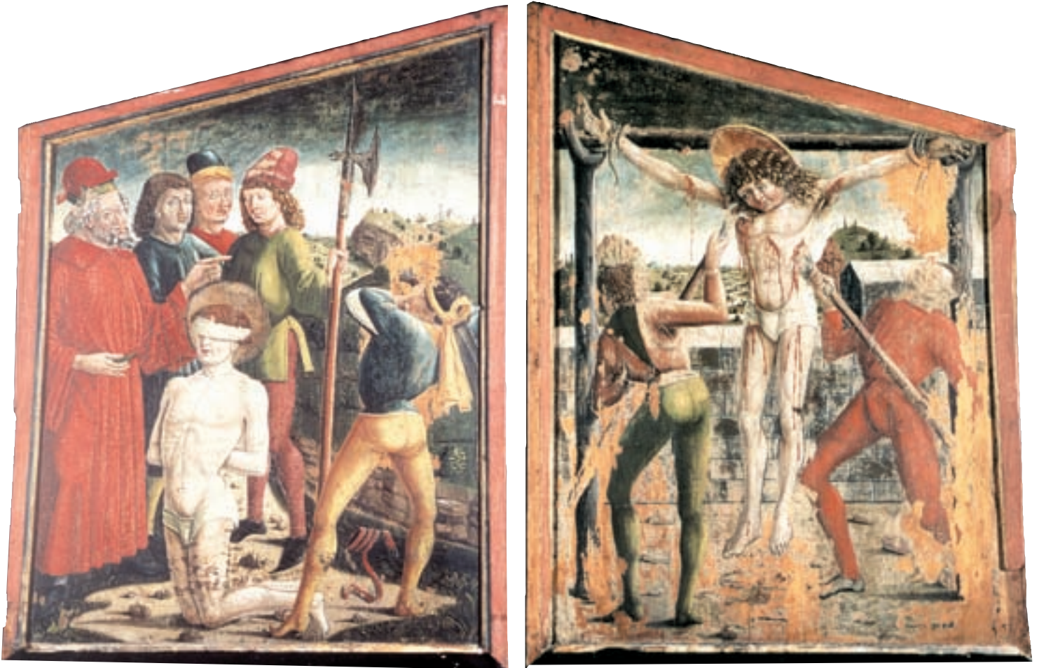
Vorder- und Rückseite eines aus Kals a. Gr. stammenden spätgotischen Altarflügels mit Szenen aus dem Martyrium des hl. Georg, seit 1891 im Stadtmuseum Bozen. – Direktor Dr. Stefan Demetz für das kostenlose Bereitstellen der Farbaufnahmen herzlichen Dank. Fotos: Stadtmuseum Bozen

Erich Egg, bekannt durch eine Unzahl von wissenschaftlichen Arbeiten besonders zur Kunst- und Kulturgeschichte des Landes Tirol, hat errechnet, dass vom spätmittelalterlichen Bestand an Flügelaltären – in ihrer Gesamtheit oder in Teilen – in den Kirchen Tirols nur ungefähr 15 % des ursprünglichen Bestands erhalten geblieben sind 1 . Aus Kals a. G. sind Fragmente überliefert, aus denen sich ein Flügelaltar rekonstruieren lässt, wertvolles