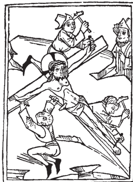
Gegenüberstellung der Szenen Kreuztragung – Entkleidung Christi und Kreuznagelung (Fotos: Christof Gaggl; die Holzschnitte aus: Albert Schramm, Der Bilderschmuck der Frühdrucke , Bd. IV, Leipzig 1921, Taf. 82 - 84).

richtig wird das gespannte Seil, das der vorwärts strebende Knecht Jesus um die Mitte, sich selbst aber über die Schulter gelegt hat, zum Vektor einer dieses Kräfte messen überwindenden Anstrengung. Nicht einmal der Pfeiler zwischen den Jochen vermag sich ihr entgegenzustellen. Der Prospekt dehnt sich aus auf die nächste Szene. Dort reißt man Jesus den Rock vom Leib, „der nun aber in seine wunden was pachen und erhörtet in dem plut.“ Kein Wunder, dass bei dieser Aktion erneut die Wunden am ganzen Körper aufplatzen.