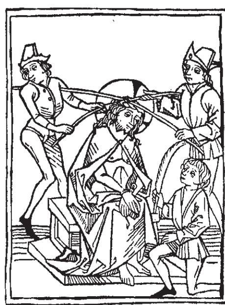
Gegenüberstellung einzelner Holzschnitte im Werk „Ein loblicher Passion ...“, erschienen in Augsburg 1480 mit den Fresken des Simon von Taisten in Obermauern: Jesus vor Pilatus – Geißelung – Dornenkrönung.

zusammenfassen, bilden in Obermauern den Raumgrund. Er begreift die sichtbaren Dinge als natürliche Erscheinungsweise des Lichtes, das daher auch nicht – wie in der gotischen Kathedrale – „übernatürlich“ 6 , sondern „naturalistisch“ gemalt ist. Sein Verhältnis zur Bildhandlung, die ebenfalls zeilenweise über die beiden Joche erzählt wird, bleibt aber unbestimmt. Maßwerkimitationen vermitteln zwischen Architektur und Malerei, deren ästhetische Grenze zum architektonischen Raum aus gedrehten Säulchen und Simsen ein Gitter aufbaut, das die Leidensgeschichte in einzelne Bildfelder gliedert. Eliminiert man – gedanklich – diese Kulissen, leidet außer dem Raumbild auch die Erzählung.