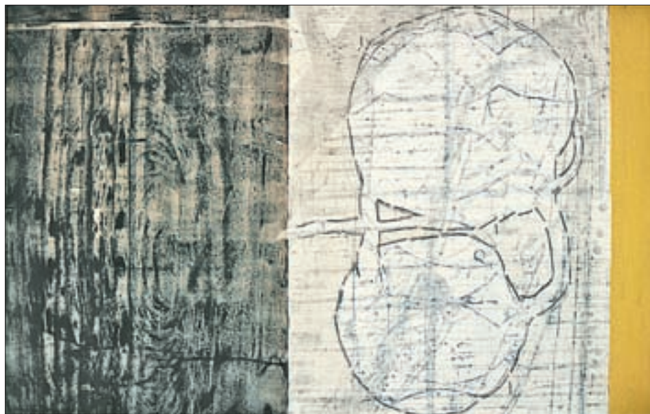
1998-2000: Ohne Titel, Mischtechnik auf Leinen, 50 x 85 cm.

Unspektakuläre Ausformungen der Natur, künstlich manipulierte Landschafts-