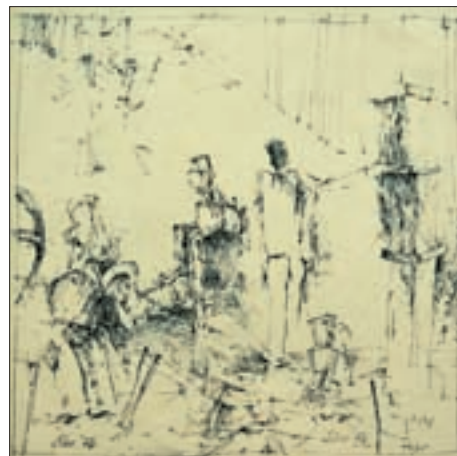
Die Tuschezeichnung auf Papier, 19 x 20 cm, entstand am Beginn der Akademiezeit in Wien, 1977.