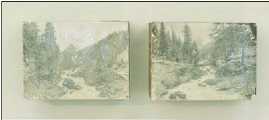
Zwei alte Fotografien als Fundstücke zum zweiteiligen Objekt arrangiert, beweisen die variable Betrachtungsbreite des Alltäglichen. Fundstücke-Objekte, 17 x 23 x 9 cm, Fotos auf Karton, 2004.

Zahlreiche Preise und Auszeichnungen, wie 1989 das Rom-Stipendium des Österreichischen Bundesministeriums für Unterricht und Kunst, 1993 das begehrte Paris-Stipendium des Kantons Zürich, 1995 das Chios-Stipendium des Landes Tirol, 1996 der Förderpreis des Landes Tirol, 1999 der Kunstforum-Preis Montafon des Landes Vorarlberg und schließlich 2001 der Deutsch-Schweizerische Kunstpreis zu 500 Jahre Kanton Schaffhausen, bestätigen sozusagen als offizielle Rahmung Othmar Eder's Kunstauffassung. Die über Jahrzehnte kontinuierlich gepflegte und geforderte Ausstellungspräsenz in ausgesuchten Galerien, Räumen und Hallen in Österreich, der Schweiz, Deutschland und Spanien beweisen seine Tendenz, sich weiter nach vorwärts zu entwickeln und dabei sein Publikum immer wieder aufs Neue überraschend zu überzeugen. Als ebenso