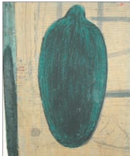
▲ 2000: Ohne Titel, 31 x 25,4 cm, Pigmente und Kohle auf Holz.

Monochrome Bildfelder korrespondieren mit grafisch bearbeiteten Passagen und zeugen von der stoischen Geduld des Kunstschaffenden, Punkt für Punkt einer Kontur zu folgen, sie nachzusteichen, oder in beinahe ritueller Rhythmik bildnerische Arbeiten vorzubereiten, sie reifen zu lassen und doch eine endgültige Fertigstel-