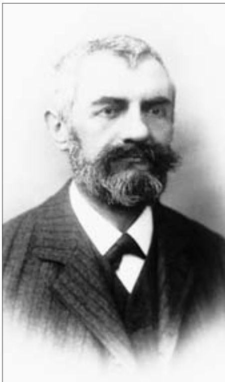
P. P. Passler auf einem sogenannten Visite-Porträt, datiert handschriftlich auf der Rückseite: Feber 1911.

Die Antholzer Familie brachte mit Peter Passler (oder Paßler) einen Mann hervor, der aufgrund eines verlorenen Prozesses in wirtschaftliche Schwierigkeiten geraten war. Dadurch wurde er zu einem Unruhestifter, dessen Verurteilung und geplante Hinrichtung im Jahre 1525 mit ein Grund für den Ausbruch der Bauernkriege war 3 . Der Passlerhof (aufgeteilt auf Vorder- und Hinterpassler) existiert noch heute, ist allerdings nicht mehr im Besitz dieser Familie 4 .