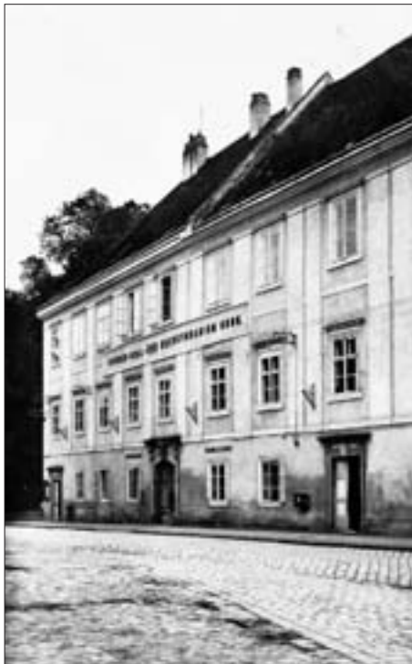
Das alte Gymnasium in Horn.

In den Jahren 1925 bis 1927 publizierte er eine lose Serie von Artikeln über das Defereggental in den Osttiroler Heimatblättern. Der erste Aufsatz, „Die Entstehung und Entwicklung des Defereggerhandels“, trägt den Vermerk „Beim Preiswettbewerb 1923 des Fremdenverkehrsausschusses der Stadtgemeinde Lienz preisgekrönte Arbeit“. Der