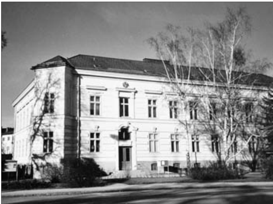
Das ehemalige Gymnasium in Berndorf.

Artikel greift manches aus jenem in der Zeitschrift für Volkskunde wieder auf, wobei der Hausierhandel recht ausführlich dargestellt wird, während die Tracht und die Problematik des Identitätsverlustes nur gestreift werden. Allerdings fasst Passler pessimistisch zusammen: „Der urwüchsige Dialekt ist verwässert, abgeschliffen, die Tracht völlig verschwunden. (...) heute muß man sich an den Bund der Tiroler in Wien wenden, wenn man ein Trachtstück sehen will. So wird auch der Deferegger Kaufmann immer mehr zum Wiener, Prager, Budapester usw. werden, bis das Heimatgefühl völlig erlischt.“ Aus eigener Erfahrung kann der Verfasser dieser Zeilen bezeugen, dass Passler sich hierin erfreulicherweise geirrt hat!