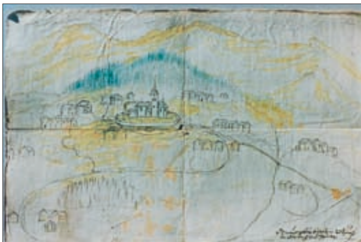
Ansicht von St. Veit, kolorierte Federzeichnung, 1728. (Brixen, Diözesanarchiv).