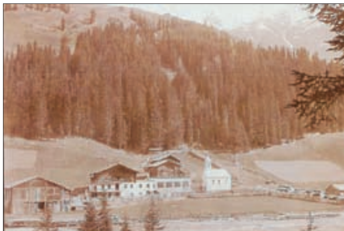
Zotten um 1900