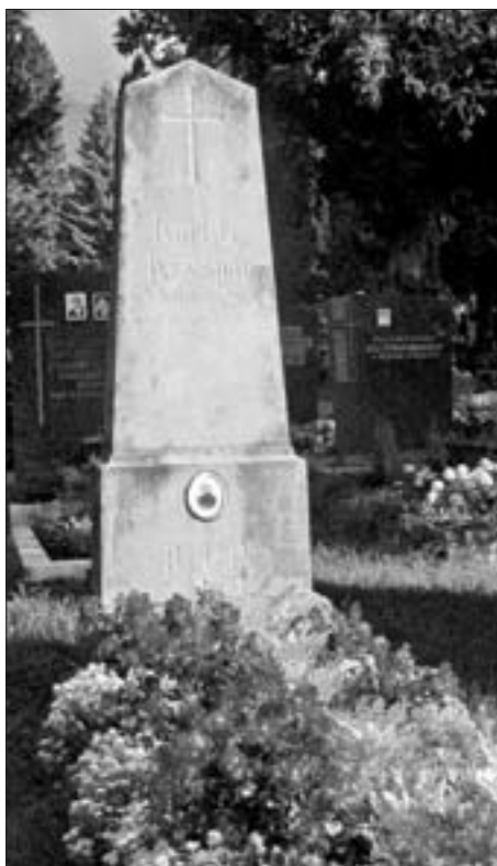
Grabstätte von Carl Georg Kryspin am Städtischen Friedhof in Lienz (Aufnahme September 2005).

Carl Georg Kryspin starb am 11. November 1908 im Alter von nur 42 Jahren.