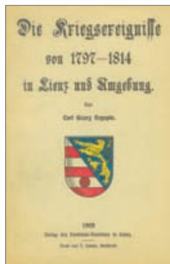
Titel-seite des Buches über die Kriegsergebnisse in Lienz in der Napoleonischen Ära, verfasst von Carl Georg Kryspin.

Unweit von Mayerling liegt die Ortschaft Maria Reisenmarkt und westlich von ihr über einem Steilabfall die Ruine der Burg Arnstein, die um die Mitte des 12. Jahrhunderts erbaut worden sein dürfte und 1529 von den Türken zerstört wurde. Als Besonderheit erscheint dort unterhalb des eigentlichen Burggeländes