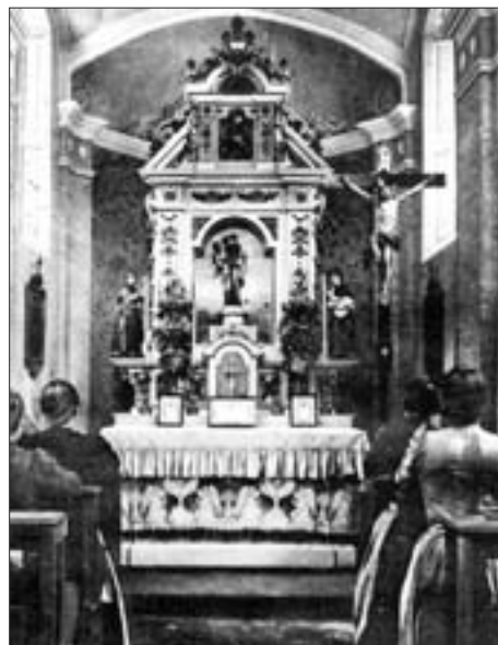
Innenansicht der „neurenovierten Kapelle in Zotten“.