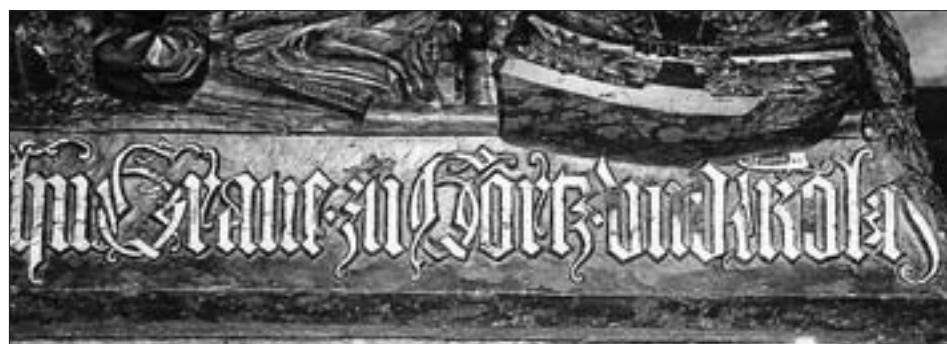
„Graue zu Görtz vnd Tirol“, Ausschnitt aus der vergoldeten Umschrift von Graf Leonhards Grabplatte in Lienz, St. Andrä.

Die Hochzeit verzögerte sich. Sie kam am vorgefassten Termin nicht zu Stande, auch im Jahr 1478 gab es ständig Behinderungen: Einmal waren es die Türken, die die Görzer Grafschaft bedrohten, dann war es die Pest, die Lienz heimsuchte. Schließlich erkrankte Paola schwer und im Frühjahr 1478 starb ihr Vater, Markgraf Ludovico II. Endlich kam die Heirat am 15. November 1478 in Bozen im Beisein des Tiroler Landesfürsten Erzherzog Sig-