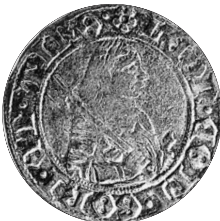
Graf Leonhard in Halbfigur mit dem Kriegsbeil auf einem Sechs-Kreuzer-Stück („Sechser“), geprägt in der Görzischen Münzstätte Lienz, um 1495, Silber, Orig.-Dm. 24 mm.

Im Ministerialadel besonders der letzten Jahrzehnte der Görzer Herrschaft ist vor allem im südlichen Teil der Grafschaft eine gewisse „Verwilderung“ eingetreten, und manche Geschlechter spielten durch-