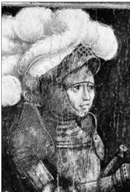
Graf Leonhard, Ausschnitt aus einem Altarflügel, Werk eines einheimischen Malers (?) aus den Jahren 1500/1510. Der Altar, eine Stiftung Maximilians I., stand ursprünglich in St. Andrä. Heute befinden sich die Altarflügel auf Schloß Bruck.

Innenpolitisch gesehen war die Lage der Görzischen Städte im 15. Jahrhundert nicht ungünstig. Görz war Mittelpunkt der inneren Grafschaft, Festung, Markt, zeitweiliger Sitz des Hofes und nahm an der spätmittelalterlichen Blüte der friaulischen Städte teil. – Was die Haupt- und Residenzstadt Lienz in der vorderen Grafschaft