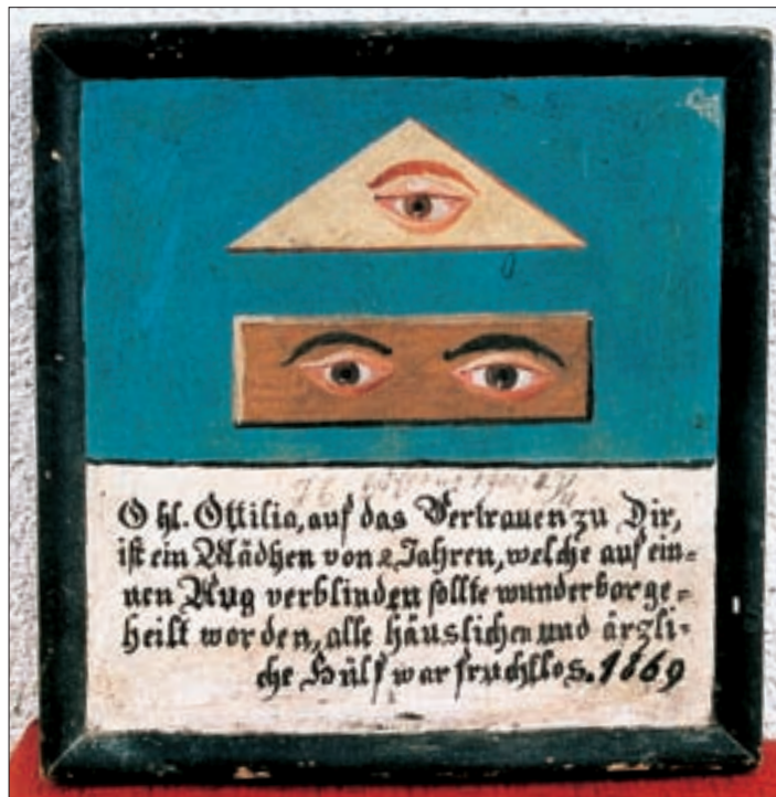
▲ Votivtafel mit Attributen der hl. Ottilie und Text v. J. 1869. Öl/Holz, 28 x 21,5 cm.