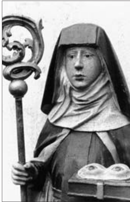
Spätgotische Statue der hl. Ottilie in der Kirche zu Amlach, um 1470; Aufnahme von 1971.

Freilich ist ein Kircheninventar, das vor rund 270 Jahren angelegt wurde, heute kaum mehr als relevant zu betrachten; zu lang ist der zeitliche Abstand, zu viele Ereignisse sind mittlerweile eingetreten und