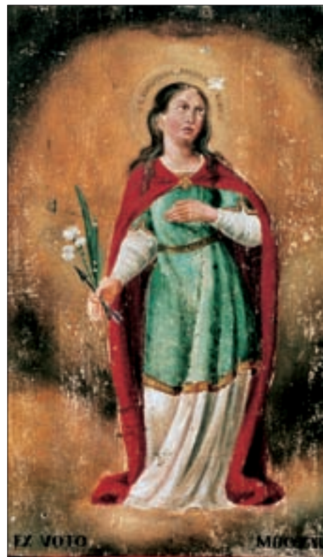
„EX VOTO MDCCCXLVIII“ – Votivtafel mit Darstellung der hl. Philomena, die insbesondere im 19. Jh. in Amlach verehrt wurde. Öl/Holz, 44,5 x 29,5 cm.

zweifache Ausführung des Inventariums und die Hinterlegung beim Gotteshaus bzw. Mesner zur fleißigen Handhabung und Beherzigung zur Sprache kommen. Eine siegelmäßige Zeichnung scheint auf unserem Exemplar entweder unterlassen worden oder in Verlust geraten zu sein.