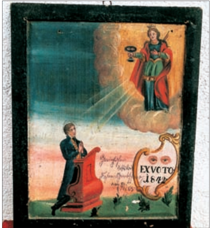
▲ „EX VOTO. 1842“ – Votivtafel zur hl. Otilie. Öl/Holz, 32 x 26 cm. ▼ Votivtafel zu den hll. Otilie, Luzia und Apollonia, 1857. Öl/Holz, 30 x 22 cm.

wantenes Altar/Tuech mit Pfizen./Zway Reistene mit Kolich 35 /Pfizen./Ain Brief 36 /Zway Möß Piecher./Ain Salzburgerisches ritual 37 /Ain brixnerisches deto/Ain Evangel Puech./