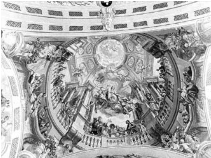
▲ Bemalung der Flachkuppel der Pfarrkirche von Telfes im Stubaital als Beispiel der Beherrschung der Perspektive durch Anton Zoller, 1757.