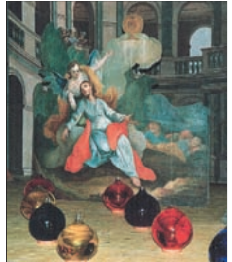
Abendmahlszene (links) und „Christus am Ölberg“, aufgestellt am Gründonnerstag.