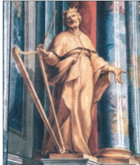
König David mit der Harfe, Ausschnitt aus der Vorderwand des Heiligen Grabes (links) und Signatur des Künstlers mit Datierung auf der Rückseite des gemalten Rundbaues im Hof von Pilatus' Palast.

Die Darstellung zum Gründonnerstag zeigt Christus inmitten der zwölf Apostel, von denen der sich abwendende Judas Ischariot eindeutig als „Außenseiter“ gekennzeichnet ist. Von Jesus, der seinen Blick zum Himmel erhebt, scheint ein Licht auszugehen, das nach außen hin ab-