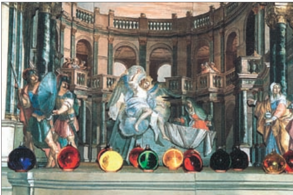
„Die Frauen am leeren Grab Christi“ (Ostersonntag) und „Christus erscheint Maria Magdalena“ (Ostermontag).