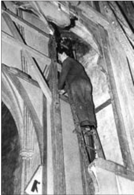
zen. Die Klapper hintern Altar tragen. Leuchter neben Sakristeitüre.“

Am Gründonnerstag fanden um 5 Uhr früh eine Segenmesse und um 7 Uhr das Hochamt statt. In diesem Rahmen wurde das Allerheiligste beim Kreuzaltar ausgesetzt und die Zeremonie der Fußwaschung vorgenommen. Um 7 Uhr abends betete man am Kreuzaltar den Rosenkranz mit anschließender Stationsandacht.