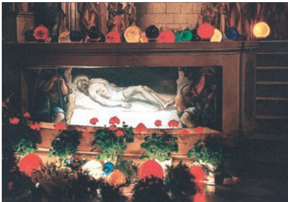
Der vom Kreuz abgenommene Leichnam Christi im Grab, bewacht von römischen Soldaten. Die bunten Kugeln verleihen dem Mittelpunkt des Heiligen Grabes einen geradezu mystischen Glanz.

Vor der Auferstehungsfeier am Karfreitag wird die „Bühne“ des Heiligen Grabes geräumt: Pilatus, Jesus und das Volk verschwinden, es bleiben nur der Leichnam im Grab und seine Wärter. Auch das Allerheiligste in der Gloriole hoch oben blieb weiter zur Anbetung ausgesetzt. Während der Auferstehungsfeier senkte sich dann der Strahlenkranz, der Priester nahm die Monstranz heraus, hinter der bereits – durch einen weißen Vor-