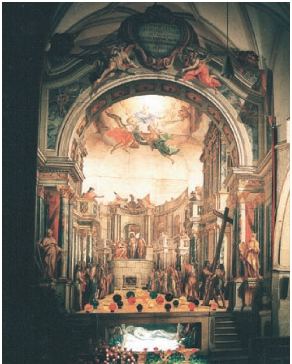
Das Heilige Grab (Ostergrab) in der Lienzener Stadtpfarrkirche St. Andrä mit der Karfreitagsszene nach der Restaurierung des Jahres 1987.

Das größte und interessanteste Heilige Grab im ganzen Bezirk ist das von St. Andrä in Lienz, das überhaupt zu den ältesten und künstlerisch wertvollsten Werken seiner Art in ganz Tirol zählt 5 . Seine Entstehung vor 250 Jahren ist eingebunden in den sehr gut fassbaren Rahmen barocker Volksfrömmigkeit.