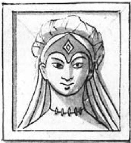
Römisches Relief mit Frauenkopf, ehemals über dem Haupteingang von St. Andrä eingemauert; lavierte Federzeichnung von Anton Roschmann, 87 x 80 mm, um 1750. (Tiroler Landesmuseum Ferdinandeum, Bibliothek, Dip. 938)

Man stieß auf insgesamt drei Vorgängerbauten der jetzigen gotischen Kirche. Die älteste Anlage (Bau I) stellte eine einfache Saalkirche mit eingezogener halbkreisförmiger Apsis dar, wobei der Laienraum eine Länge (Innenmaße) von 14,2 m und eine Breite von 9,2 m aufwies. Im Apsisbogen war eine 0,6 m tiefe Klerikerbank mit erhöhtem Mittelsitz eingebaut, vor dem sich das Reliquiengrab befand. Zu seiner Umgrenzung benützte man spätrömische Reliefsteine vom Ende des 2. nachchristlichen Jahrhunderts in Zweitverwendung. 10 Darüber erhob sich der frei stehende Altar. Dieser frühchristliche Bau kann in das 5. Jahrhundert datiert werden. 11 Unter der Apsis befand