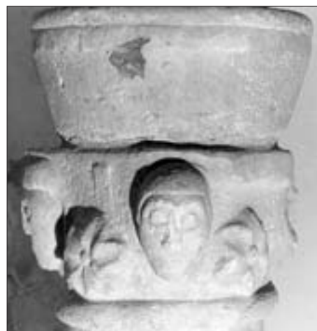
Romanisches Säulenkapitell mit später aufgesetztem Weihwasserbecken; das Kapitell mit einer Höhe von 21 cm zeigt drei Köpfe (ein Kopf zerstört) und vier Rosetten (eine Rosette zerstört); der 86 cm hohe Säulenschaft mit Kapitell befindet sich heute in der Gruft der Pfarrkirche St. Andrä.

Kein Zweifel, hierunter sind höchst bedenkliche Stücke. Doch damit war man in bester Gesellschaft. Unter den Reichkleinodien, die seit 1424 in Nürnberg aufbewahrt und bis 1523 alljährlich dem Volk gezeigt wurden, befanden sich unter anderem folgende mit Ablässen verbundene Reliquien: ein Kreuzsplitter, ein Span von der Krippe Jesu, ein Stück vom Schurztuch Christi, Glieder aus den Ketten, mit denen Petrus und Paulus gefesselt waren, das Tischtuch vom Letzten Abendmahl, fünf Dornen aus der Krone Christi. Im ehemaligen Benediktinerkloster St-Riquier in der Diözese Amiens verwahrte man Stücke vom Mantel und von den Sandalen Christi, etwas vom Brot, das er an seine Jünger ausgeteilt hatte, Milch von der Jungfrau Maria, Haupthaare Johannes' des Täufers und Barthaare Petri, mit Blut befleckte Steine, mit denen der hl. Stephan gesteigt worden war, und vieles andere mehr.