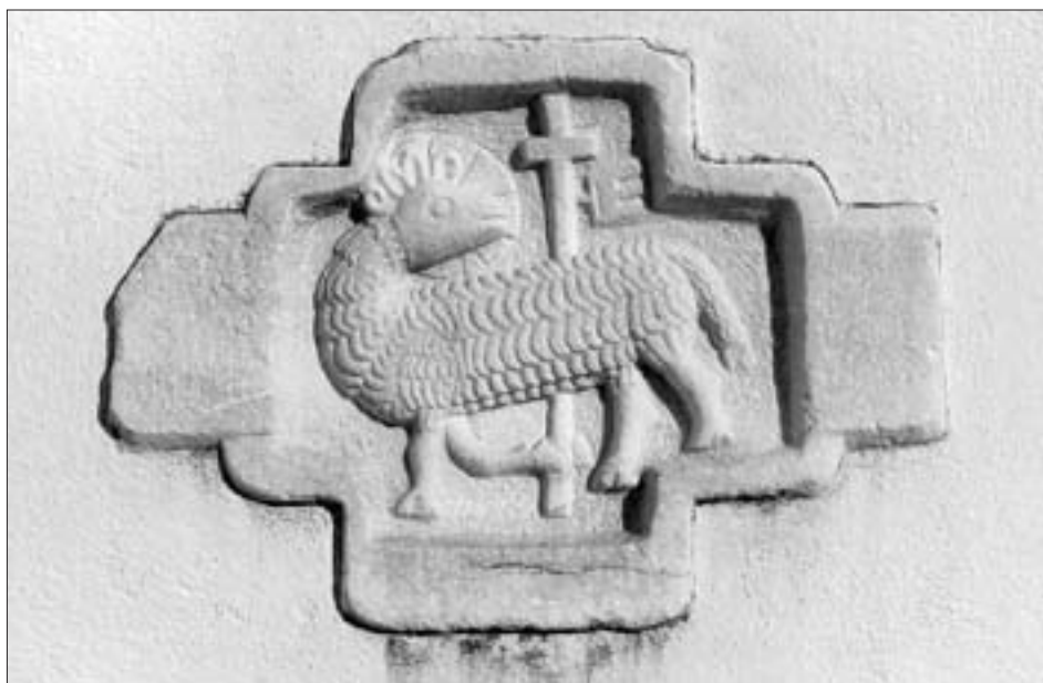
▲ Reliefstein aus weißem Marmor mit dem Lamm als Symbol Christi, Kreuzstab und Fahne, heute über dem rechten Seitenportal von St. Andrä, 50 x 69,5 cm.

Schwierigkeiten bereitet die Reliquie der Jungfrau Anafreda im St. Oswaldaltar. Im kirchlichen Kanon der Seligen und Heiligen gibt es keine Anafreda. Weder die Bibliotheca hagiographica 12 noch die Bibliotheca Sanctorum 13 erwähnen sie. Die Vorsilbe Ana passt nicht zu einem germanischen Namen. Höchstwahrscheinlich handelt es sich um eine Verschreibung für Ans, ein geläufiger Bestandteil fränkisch-deutscher Namen wie Ansbald, Ansbert, Ans(h)elm, Ansgar, Anstrud. 14 Es begegnet auch Ansfrid (Ansfredus), die weibliche Form dazu ist Ansfrida, Ansfreda. 15 Es gibt einen seligen Ansfrid, 16 aber dieser kann nicht gemeint sein, da in der Weihenotiz nach Anafreda der Zusatz virginis steht. Wie Anafreda erscheint auch Ansfreda in keinem Werk über Selige und Heilige. Förstemann erwähnt eine Ansfrida im Merowingerreich