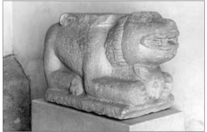
Die beiden steinernen romanischen Portallöwen von St. Andrä, die sich ursprünglich wohl beim südseitigen Nebeneingang befunden haben; die Höhe beträgt bei beiden 46 cm, die Länge des linken Löwen 90 cm, des rechten 82 cm, der Durchmesser der Säulenauf- lage ca. 35 cm.

die Separierung von Kopf und Leib. Bis zum 10. Jahrhundert bestand die Masse der Heiltümer aus Sekundär- bzw. Berührungsreliquien. Man versteht darunter alles, was ein Heiliger besessen, berührt oder besprochen hat, sowie alles, was im oder auf dem Grab verwendet wurde (Tücher, Salbenöl, Staub von der Abdeckplatte des Grabes usw.). Die körperlichen Überreste werden als Primärreliquien bezeichnet. Die Vielzahl von Partikeln, die durch die Teilung der Leichname seit dem 10. Jahrhundert entstanden, sind ebenso heilsam und wunder-tätig wie der ganze Körper der Heiligen.