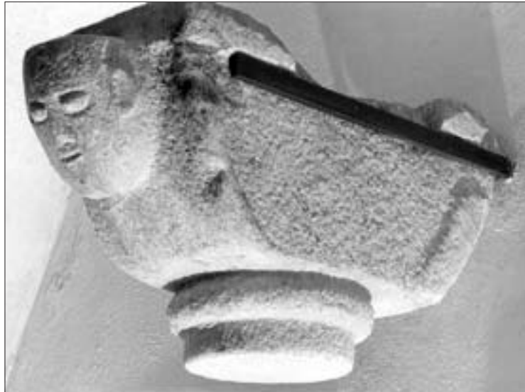
Sog. Kämpfer, ehemaliges Zwischenstück zwischen einer Säule mit Kapitell und einem gemauerten Bogen, mit dem Motiv eines Kopfes an der Vorderseite; die Höhe beträgt 37 cm, die größte Länge 67,5 cm, die Breite 26,5 cm, Durchmesser des Säulensansatzes 20 cm (heute in der Gruft).

Die begehrten Jesus- und Marienreliquien riefen skrupellose Fälscher auf den