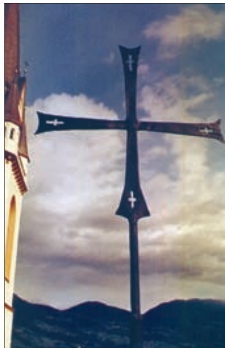
Schmiedeeisernes romanisches Kreuz am westlichen Giebel von St. Andrä; Aufnahme 30. September 1968.

Seine Gebeine wurden 357 in die Apostelkirche nach Konstantinopel übertragen. Die Stadt ließ ihm besondere Verehrung zuteil werden und feierte ihn in Rivalität zu den römischen Apostelfürsten Petrus und Paulus als Erstberufenen des Herrn. Nach der Eroberung von Byzanz durch die Lateiner, durch die abendländischen Kreuzfahrer (1204) übertrug der Kardinal Petrus von Capua, aus Amalfi gebürtig, 1208 die Gebeine des hl. Andreas in seine