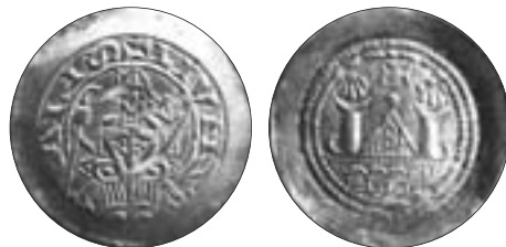
Eine der ersten Silbermünzen der Grafen von Görz, geprägt in der Lienzer Münzstätte vor 1200; die Vorderseite zeigt ein stilisiertes Bildnis des Patriarchen von Aquileia und die Umschrift „LIVNZALIS“; Orig.-Dm. 20 mm.

Eine Wende trat ein, als sich um 610 die von Osten heraufziehenden Slawen und die über das Pustertal herabkommenden Bajuwaren bei Aguntum eine Schlacht lieferten, wobei die Bajuwaren unterlagen. Nun scheint auch die ohnehin schon geschwächte und von früheren Einfällen teils zerstörte Stadt Aguntum aufgelassen worden zu sein, wobei die Siedlung um St. Andrä Zuzug erhielt. 14 In der Folgezeit besiedelten die Slawen den Lienzer Raum