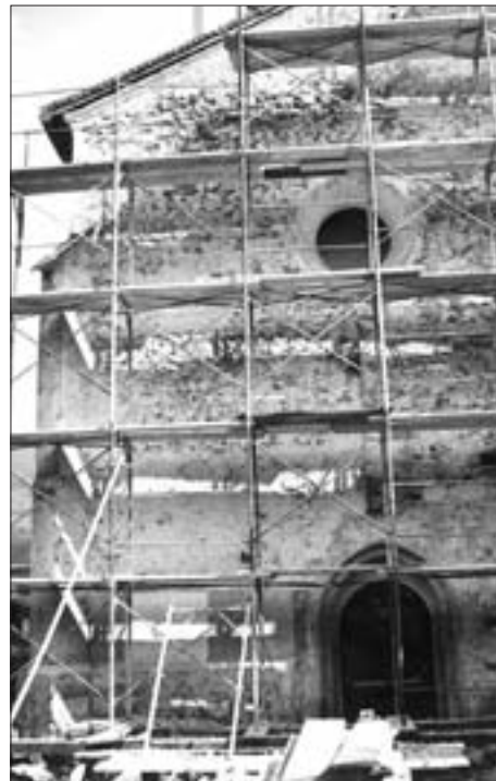
Nach Abschlagen des Putzes der Westfassade im Jahr 1968 war die ehemalige Nord-West-Kante der romanischen Kirche zwischen dem Spitzbogen des linken gotischen Seitenportals und dem darüber liegenden Rundfenster gut zu erkennen; Aufnahme 9. September 1968.

ten konnte? Oder empfand man sie als zu „antiquiert“ und wollte sie durch einen „modernen“ Bau ersetzen? Der aktuelle Stil der Zeit um 1200 war die Romanik, die einen Kirchenbau als Festung Gottes inszenierte. Der massive Bau weist durchwegs schmale Fensterschlitze auf. Im Vergleich mit der Stiftskirche von Innichen, deren Neubau nach 1200 begonnen wurde, war St. Andrä einfach gestaltet. Durch die Ergebnisse der Grabungen von 1968 und die richtige Einordnung der vorhandenen Relikte ist es möglich, das Aussehen der Kirche einigermaßen zu rekonstruieren. 23 Im Gegensatz zu den Vorgängerbauten ist von diesem Bau sogar noch aufgehendes Mauerwerk erhalten geblieben, das in die Westfassade des gotischen Baus einbezogen worden ist. Die von der ehemaligen aus Steinquadern aufgebauten Nord-West-Kante herrührende Wandfuge war nach Abschlagen des alten Putzes (1968) deutlich zu erkennen. Das Langhaus (Laienraum) reichte im Westen