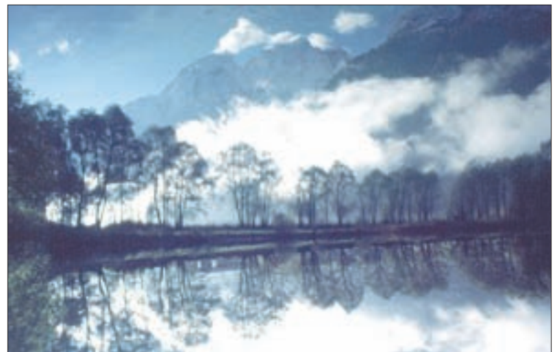
Schotterteiche bei Lavant, südlich der Lavanter Brücke – beliebte Einstandsplätze der Graureiher.