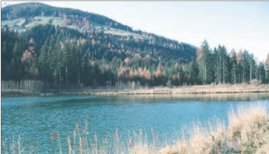
Speicher Tassenbach, mit 7 ha Größe, bietet seit rund zehn Jahren die meisten Graureiher-Beobachtungen im Osttiroler Pustertal.