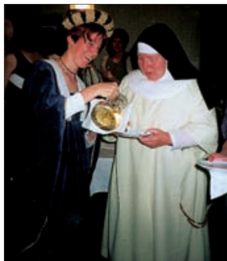
Auch Ew. Schwester Oberin lässt sich verwöhnen.