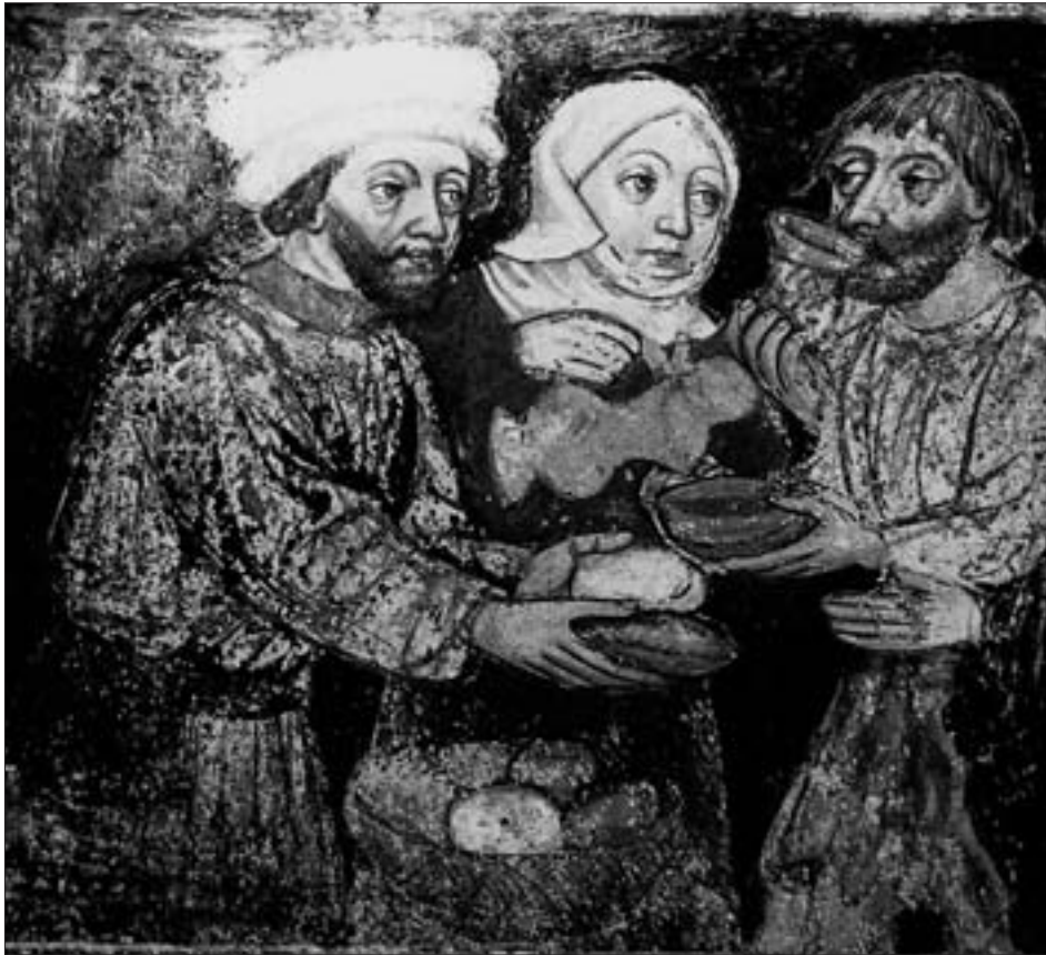
Kanne, Schüssel, Becher und Korb mit Broten, Ausschnitt aus dem Freskenzyklus „Leibliche Werke der Barmherzigkeit“ des Leonhard von Brixen, 1458/1460, in der Pfarrkirche St. Jakob in Strassen.

Ein heute besonders hoch im Kurs stehendes Lebensmittel, die Kartoffel, gelangt erst um die Mitte des 16. Jahrhunderts aus Amerika nach Europa. In der Lienzer Gegend ist sie allerdings erst um 1775 bekannt und in Verwendung, wobei Deferegger Händler, die bekanntlich halb Europa bereisten, die begehrte Feldfrucht von ihren Handelsfahrten mitbrachten. – Von Obst und zwar Äpfeln, Birnen, Kirschen, Zwetschken und Nüssen berichtet Santonino selbst. Zweifellos sammelte die Bevölkerung bereits Beeren – Heidelbeeren, Himbeeren, Erdbeeren, Johannesbeeren, Wacholderbeeren u. a. – und verwertete sie in eingedickter, vielleicht Marmeladeform und zur Herstellung von Säften. Zum Süßen stand wilder Honig oder aber auch bereits solcher von gezüchteten Bienenvölkern zur Verfügung.