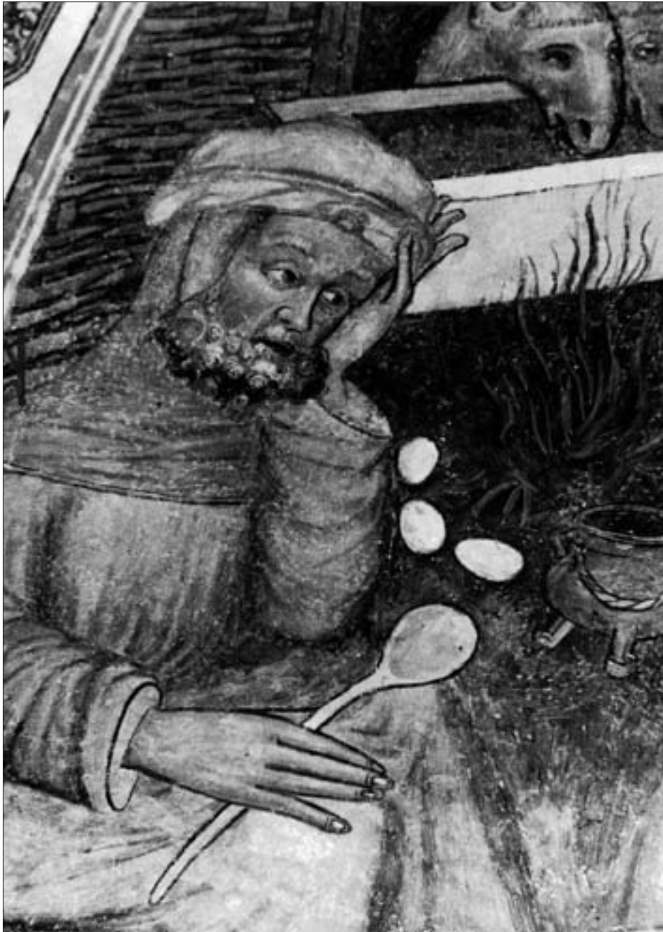
St. Josef beim Eierkochen mit Darstellung von Feuerstelle, Dreifußkessel und Kochlöffel, Ausschnitt aus dem Fresko „Christi Geburt“ in der Pfarrkirche von St. Veit i. D., Anfang 15. Jahrhundert.

Festessen erscheint der Anteil an Fischen, an Hoch- und Niederwild und Vogelvieh. Wer weiß heute noch Ausführlicheres über Kapaunen 7 oder Krametsvögel 8 ?! Unter ersteren sind kastrierte Hähne zu verstehen – als Hähnchen im Verzehr heute noch aktuell (!) – , zweite sind Wacholderdrosseln, deren Genuss einen besonderen Gaumenkitzel verhiess. Der Verzehr von Eichhörnchen schließlich ist denn doch eher als sehr ausgefallener, einmaliger Leckerbissen zu betrachten – bei den übrigen Gastmählern finden wir dieses Gericht nicht – denn als eine regionalspezifische Spezialität. Dass sich Santonino und mehrere seiner „Mahlgenossen“ des Genusses von Speck und Kraut enthoben, darf nicht verwundern; war es ihnen, wie angedeutet, zweifellos eine zu derbe, unverständliche bäuerliche Kost! Doch stand diese besonders in deutschen Landen nicht nur beim niederen Volk in hohen Ehren. „Kraut vom Kübel hilft gegen 99 Übel“ –