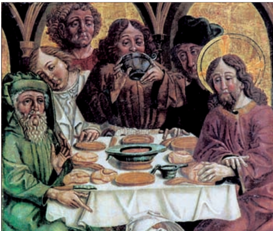
Gedeckte Tafel, Ausschnitt aus der Abendmahl-Szene am sog. St. Magdalena-Altar von 1498 in St. Korbinian, Thal-Assling. Die Ausführung des Altars wird heute dem sog. Barbarameister im Umkreis des Friedrich Pacher zugeschrieben.

Das römische Wortpaar „Brot und Spiele“ ist bis heute ein Begriff geblieben, um zu beschreiben, dass eine Regierung, Partei, Rundfunkanstalt oder sonst eine