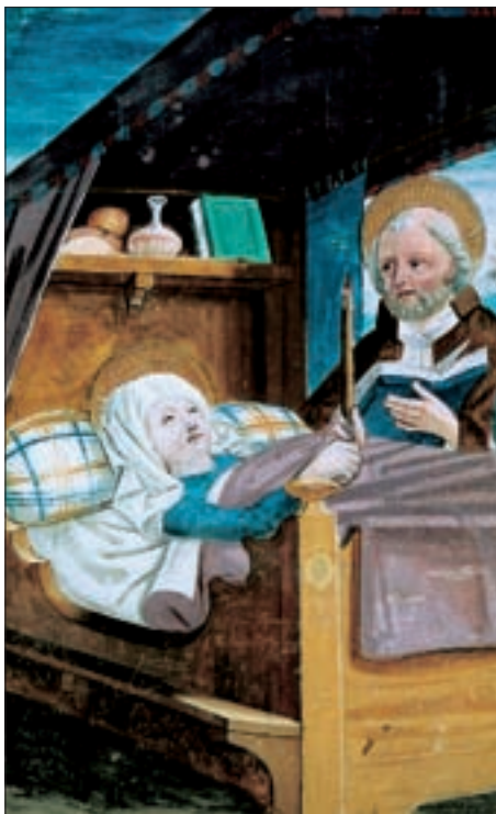
Stellage mit gläserner Karaffe und angeschnittenem Brotlaib, Ausschnitt aus dem Fresko „Tod Mariens“ des Simon von Taisten, 1490/1496, in der Kapelle von Schloß Bruck.

Die Bezeichnung „Hauswurst“ lässt aufhorchen, weil es sich dabei um ein Produkt