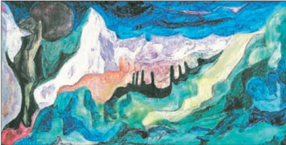
1959: Eine Landschaftsaufnahme aus der Werksreihe „Surreales“, 42 x 80 cm, Öl auf Leinen.

endete diese Ausbildung im Sommer 1950 mit der Gesellenprüfung. Was sich in den drei Jahren während seiner Lehrzeit angesammelt hat war nicht nur das unbändige Bedürfnis eines jungen Mannes, sich weniger dem Kunsthandwerk als viel mehr der Kunst zu verschreiben, sondern auch eine konkrete Vorstellung von seiner weiteren Ausbildung.