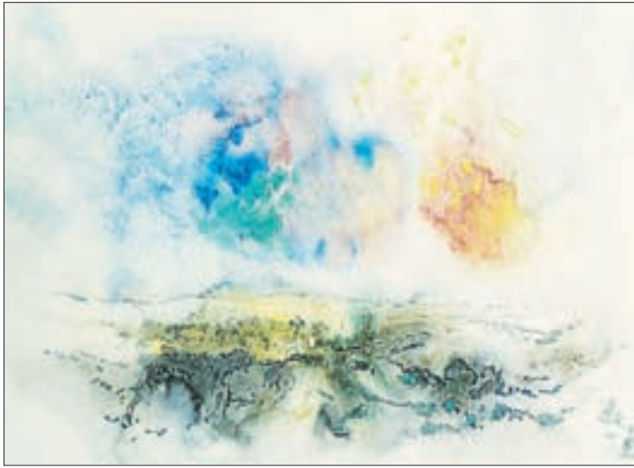
1978: „Landschaft“, 37 x 52 cm, Aquarell auf Papier.