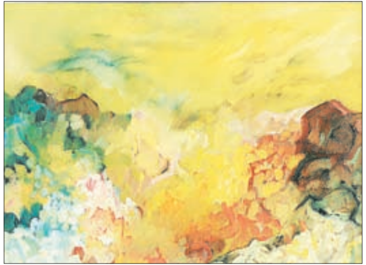
1981: „Landschaftsmetamorphose“, 35 x 50 cm, Öl auf Platte.

tallformen werden, erreicht Pedit 1959/60 einen Stil mit leuchtenden Farbbändern in Rot, Gelb und Blau, mit gelegentlichen Zwischentönen, der an frühe japanische Wandmalerei in vielen Einzelformen erinnern kann...“ 43 Surreale Erscheinungsformen beginnen seine Bildfindung zu bestimmen. Farben werden durch Formen in jene spannende Dimensionalität gebannt, in der nicht nur dem Maler sondern auch dem Betrachter zwei Dimensionen beim Erleben nicht mehr genügen. Das Prinzip der geistigen Intonierung mit den Mitteln der Technik und der Farbe findet bei Hermann Pedit schon in jener Zeit seine Anfänge und vollendet sich heute im Übermaß.