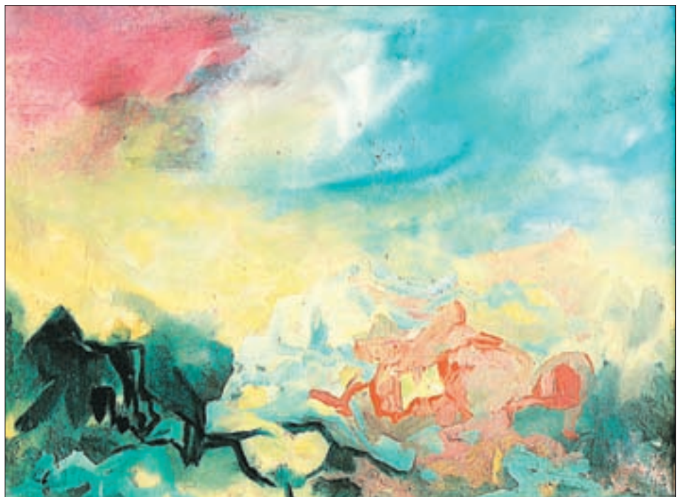
1969: Eine spanische Reise inspirierte Pedit zu diesem Landschaftsmotiv, 60 x 80 cm, Öl auf Leinen.

Sergius Pauser, der bis 1967 in Wien die Meisterschule für Bildnismalerei an der Akademie für Bildende Künste leitete und neben der Neuen Sachlichkeit vor allem dem österreichischen Expressionismus zusprach, galt als eine markante Institution in der Porträtmalerei der österreichischen Kunstszene. Studienblätter aus dieser Zeit belegen Hermann Pedit's Tendenz, bereits in dieser Phase der Ausbildung der bildnerischen Doktrin seines Lehrers entgegenzusteuern, auch wenn formale Annäherungen durchaus gegeben waren. Der selbstständige Duktus forcierte sich schon in jener Zeit zu einem eigenständigen Ausdrucksmittel einer innovativen