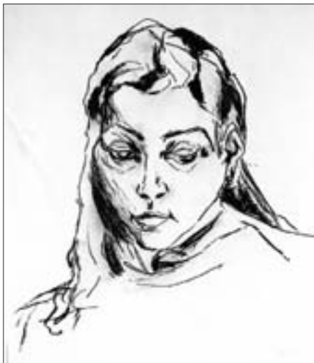
1955: „Mädchenporträt“, die Kohlestudie zeigt bereits die individuelle Eigenständigkeit in der Linienführung.

konnte er keine Förderung in eine explizit freiorientierte Kunstentfaltung erfahren, die den Akademismus des 19. Jahrhunderts zwar anerkannte, ihn aber nicht bereit war zu überwinden. Vielleicht waren es auch die Prämissen der Zeit, die das „Schönzeichnen“ einer freien Stilentwicklung vortzogen. Jedenfalls verspürte er bereits in jungen Jahren eine immanente Affinität beim Betrachten von Bildern, Plastiken und anderen kunstorientierten Sujets.