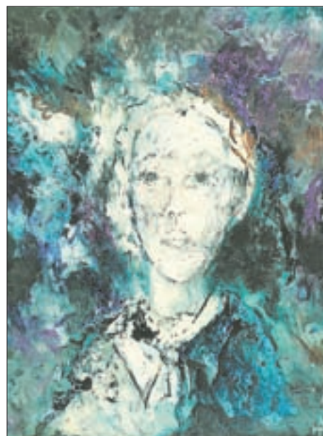
1999: Eine Porträtstudie aus dem 62-teiligen Zyklus „Nacht der Seele“, 80 x 60 cm, Mischtechnik auf Platte.