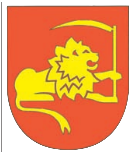
Ein nach (heraldisch) links gewandter goldener Löwe auf rotem Grund – das Wappen der Gemeinde Tristach.

Das Landesarchiv erhielt mit Schreiben des Tristacher Bürgermeisters vom 16. Oktober 1975 drei Aufnahmen.