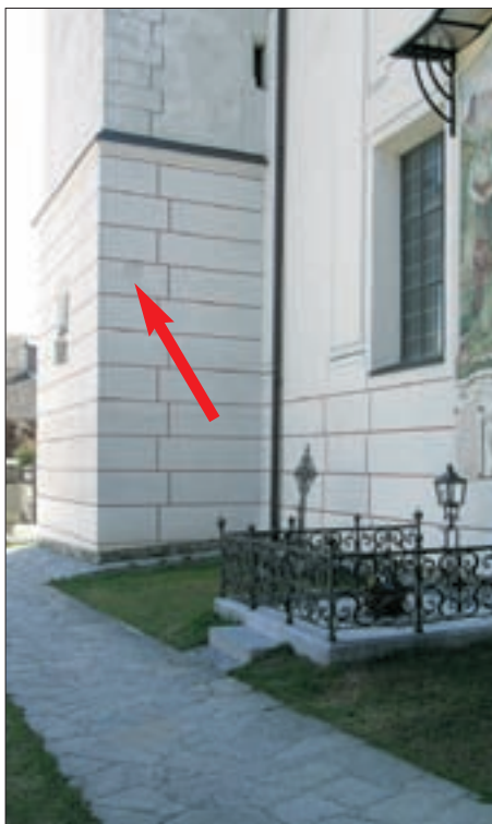
Blick auf die Nordseite der Pfarrkirche St. Laurentius in Tristach; auf der Westseite des Turms ist ein Reliefstein eingelassen (siehe Pfeil), dessen Bildinhalt lange Zeit falsch interpretiert worden ist, jedoch als Grundlage für das Gemeindewappen diente.