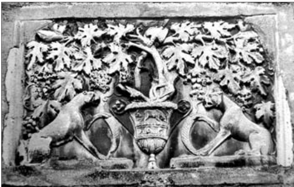
Maria Saal: Grabbaurelief vom Zollfeld-Virunum mit der Darstellung zweier sich gegenüber sitzender Panther mit Füllhorn, dazwischen Kantharos.