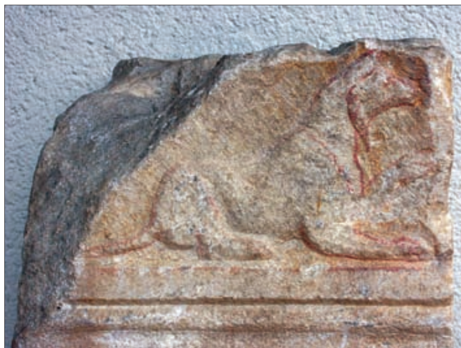
Lavant, Gemeindeamt: Architravfragment mit der Darstellung eines Panthers.