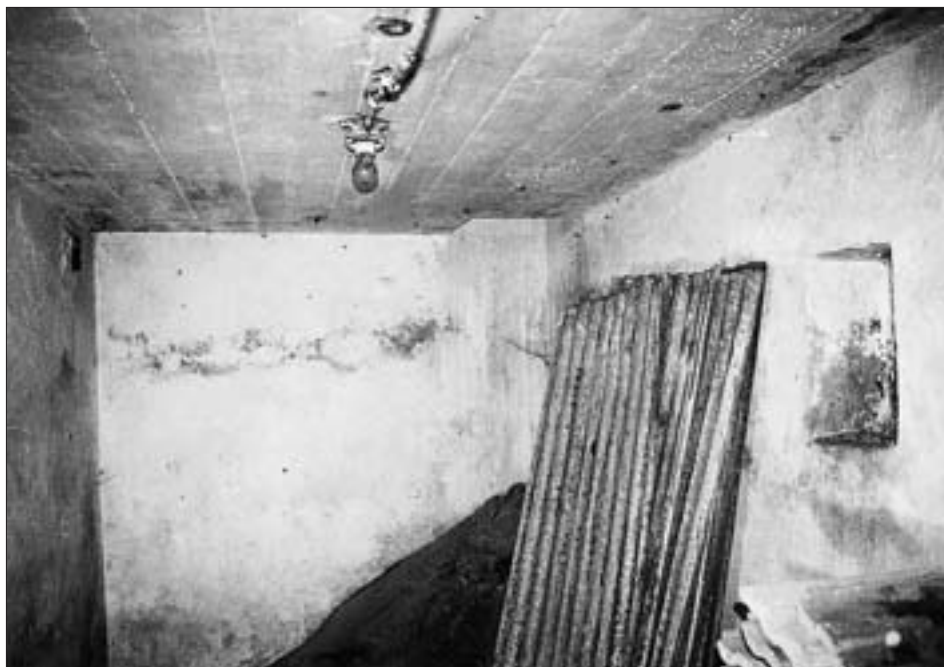
Heute noch erhaltener Betonbunker („Luftschutzraum“) aus der NS-Zeit im Garten des Hauses Siedlerstraße 1 in Lienz.

Tiroler Landesarchiv, Bezirkshauptmannschaft Lienz, Fasz. 47/1943 (Oberforcher 297/43, Gröger 298/43).