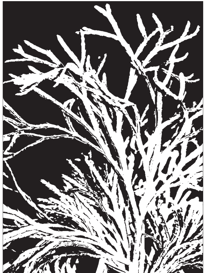
▲ Fund aus Ainets, Iseltal.