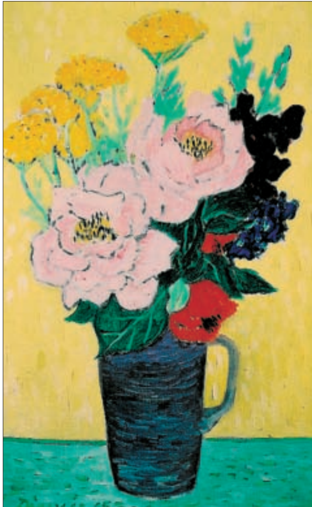
Der erste Ankauf durch die Stadt Lienz: Gerhild Diesner, Blumenstillleben, 1965, Öl auf Leinen, 65,5 x 40,5 cm.

Man kann beinahe von einer kulturellen Aufbruchsstimmung sprechen, als die ersten Vorgespräche mit den Stadtvertretern in eine zuversichtlich positive Richtung steuerten. Aus der heutigen Sicht besonders spannend sind die Entwürfe für