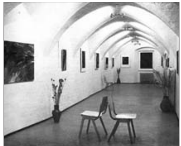
▲ Die adaptierten Galerieräumlichkeiten im 1. Obergeschoß der Buchhandlung in der Rosengasse 3.