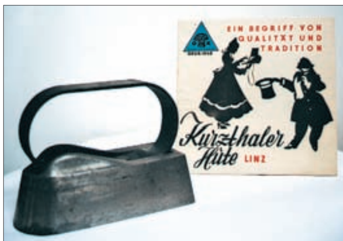
▲ Spezialbügeleisen zum Bügeln des Hutrandes. Maschine zum Vernähen der Strohgeflechte zu Hüten. ►

In Linz werden noch zwei Geschäfte eröffnet. Das eine Geschäft 1873 in der