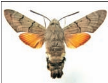
Macroglossum eggeri n.sp. aus Indonesien.

Aus Platzgründen wurden die Tiere dem Verfasser anvertraut, eine Schachtel voll Schmetterlinge ging an das Gymnasium und bei Publikationen sollte sein Name ge-