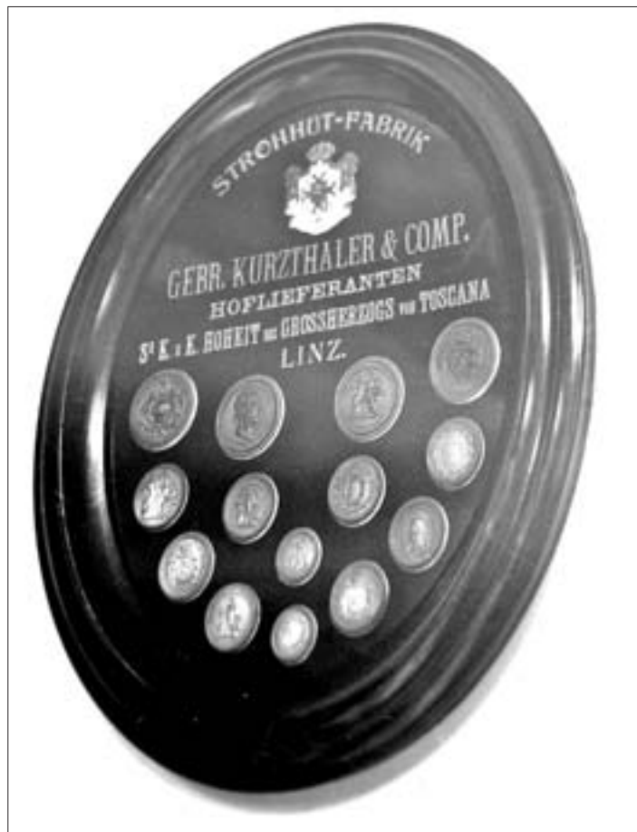
Medaillon Linz mit erhaltenen Auszeichnungen.