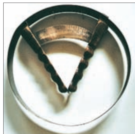
Messgerät zum Feststellen der Hutgröße.