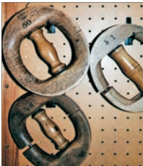
▲ Geräte zum Dehnen der Hüte.

Geschäftshaus Illensberger in Wels, ► Ecke Ringstraße/Pfarrgasse, in dem sich die Zweigniederlassung der Gebrüder Kurzthaler eingemietet hatte.