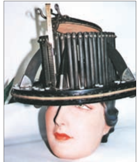
▲ Messgerät zur Feststellung der Kopfgröße des Auftraggebers. ◀ Domžale Telecomcenter, ehemalige Fabriksanlage; Villa, 1912/13 erbaut, Reichsstraße 837.

Schmidtorstraße 2 – lt. „Gewerbeschein für Handel mit Stroh Hüten, Kotzen, Teppichen, Steinfett (Steinöl, Anmerkung des Verfassers) und Wetzsteinen“ 12 , das andere 1884 in der Klosterstraße 6 (später Nr. 3) mit Gewerbeschein für die „Verschleißung von Kotzen, Teppichen, Filzhüten und Kappen und sonstigen Kopfbedeckungen mit und ohne Adjustierung“.