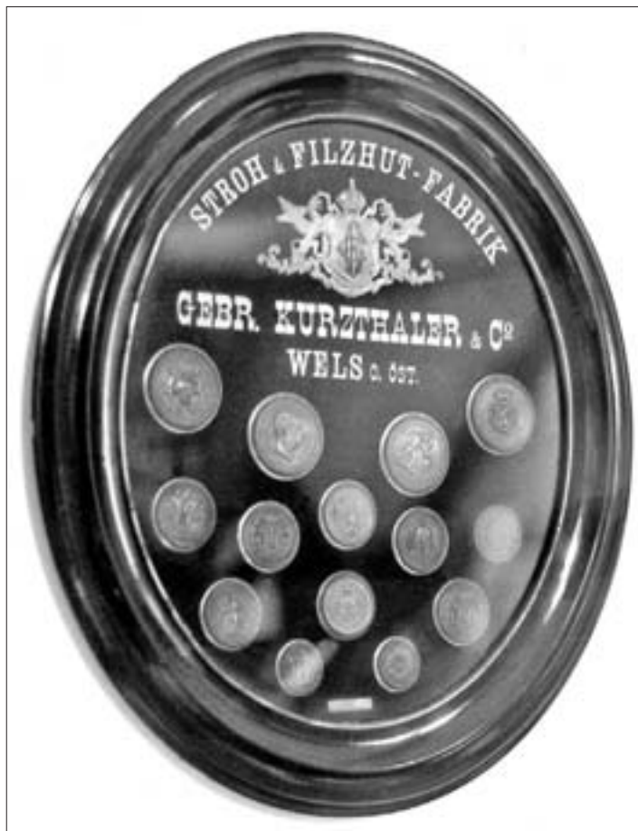
Medaillon Wels mit erhaltenen Auszeichnungen.