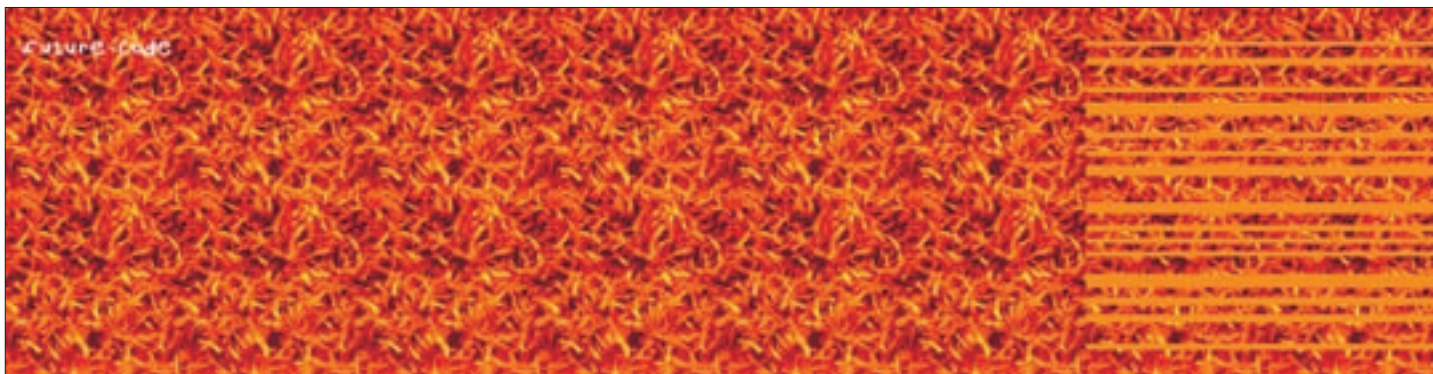
Der „future code“, Siebdruck auf acht Aluminiumplatten, 200 x 500 x 5 cm, befindet sich an der Einfriedungsmauer im Eingangsbereich des Jugendzentrums in Matrei in Osttirol.

logie“ der Nikolauskirche in Matrei in Osttirol und deren archaische Erscheinung thematisiert wurde, um „das dreidimensionale Erfassungsvermögen des menschlichen Auges der Wirklichkeit, des zweidimensionalen Ausschnittes, gegenüberzustellen“. 7 Für 2006 ist bereits eine gemeinschaftliche Projektpräsentation mit Paul Renner, Franzobel und Rosa Pock in der Deutschvilla in Strobl am Wolfgangsee geplant, in der Peter Raneburger die Geschichte der Jugendstilvilla, die im Zweiten Weltkrieg als Festung des BDM galt, inhaltlich aufbereitet.