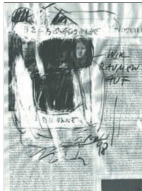
Überarbeiteter Text mit dem Titel „herbergsuche/wir räumen auf“ von 1998, 25 x 20 cm, Wachskreide, Trockenfarbe auf Papier; veröffentlicht im „Tagebuch I – eine Dreierbeziehung“ zum Thema Gruppen.

Aus dem „Tagebuch II“: „Das Konzept der Ausstellung beruht auf Reflexionen oder Reaktionen auf gesellschaftspolitische Vorgänge unter Einbeziehung ortsspezifischer Komponenten – Einzelpersonen/Einzelsymbole – nominiert oder anonym – stehen gleichsam als Sinnbilder menschlichen Tuns aus Überzeugung – Überzeugung nicht im Sinne eines Gruppenkontextes, sondern im Sinne des spezifischen Individuums...“ 44 Peter Raneburger stellt sich mit aller Konsequenz den Tabuthemen unserer Gesellschaft – er formuliert das malerische Näherbringen bis an unsere eigenen Grenzen der Akzeptanz. Wie tolerant oder ignorant sind wir Betrachter nun wirklich? Die tatsächliche Auseinandersetzung ohne verpflichtender Akzeptanz des Gesehenen eröffnet uns Betrachtern ein interessantes Spektrum der geistigen Höhen und Tiefen. Der Künstler will keine plakativen Bildsujets schaffen, um als provokante Hauptattraktion zu enden. Er zeigt nur auf, was Fakt ist – Tat-