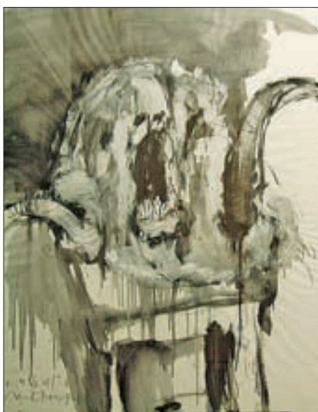
Eine Arbeit von 1998: Aus der Serie „corpse morbidi“, XCVI/98, 125 x 91 cm, Trockenfarbe und Kohle auf Papier, mit Pinselwasser laviert.

„Es ist für mich von großer Bedeutung, die verschiedensten Zugänge einer entstandenen Problematik zu durchleuchten, sie zu analysieren. Ich will die Motivation der-