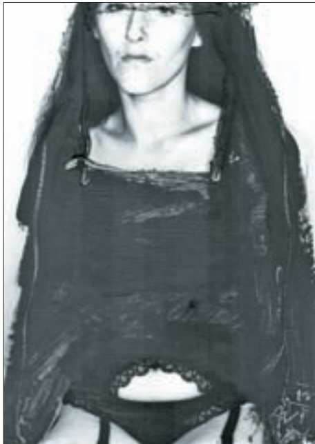
Aus dem Zyklus „Heiligenbilder“ von 2000: „braut IV“, Digitaldruck auf Plexiglas, Übermalung, 47 x 40 cm.