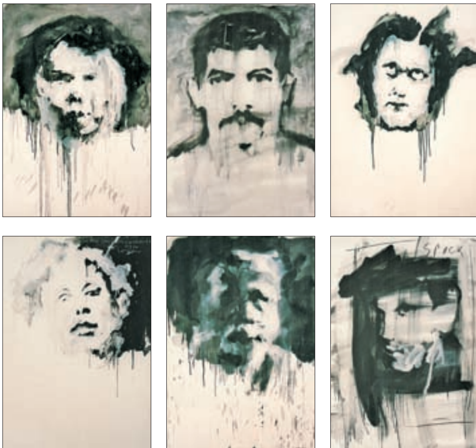
Aus der umfangreichen Bilderserie „Kranke Köpfe“ von 2001-2002: Trockenfarbe auf Papier, laviert, jeweils 100 x 70 cm.

erhielt er auch den „Förderpreis für Bildende Kunst des Landes Kärnten“ zum Thema „Grenzgänger“. Interessant ist nun die weitere Laufbahn des Kunstschaffenden, die neben dem vollständigen Ausleben eines vorab schon intellektuell induzierten Kunstwillens auch eine weniger offenkundige, aber jede seiner Projekte ideologisch begleitende Richtung mitführt.