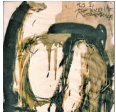
ES II: Akt, XXXII, 1995, Wachskreide, Trockenfarbe und Graftit, laviert auf Transparent, 45 x 45 cm.

Mit dem Genre Film entdeckte Raneburger ein weiteres Medium, um seine Vielfältigkeit unter Beweis stellen zu können. Als provokant irritierend kann das 1998 im Rahmen eines Festmenüs konzipierte Filmprojekt „sundaychilds – SIX“ (S8-Film) bezeichnet werden. Dazu der Eintrag aus dem „Tagebuch I“: „Interessantes Angebot des Berggasthofes – Strumerhof – Mittwochs – Kulinarium – mit fünfgängigem Menü unter Titel – kleine und große Matreier ...“ 46 Das Konzept des Films, der übrigens im Anschluss an das mehrgängige Menü als nächtliche Freilichtauffüh-