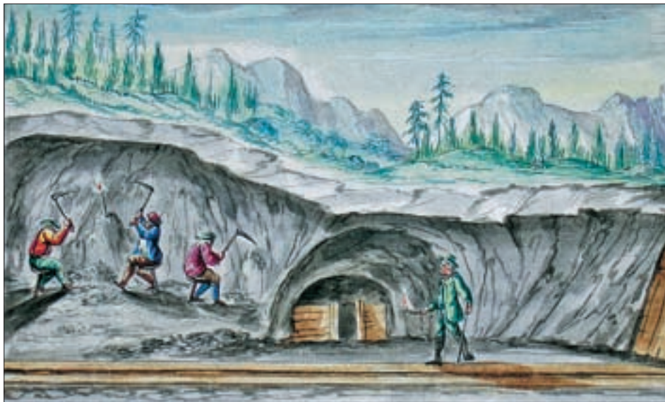
„Manipulation bey den Kaysers Berge“ – Franz Anton von Waldauf hielt in 27 Abbildungen den Arbeitsprozess der Salzgewinnung („Salz-Manipulation“) fest, beginnend mit dem Abbau im Salzberg, über die Verarbeitung im Sudhaus bis zum Verfrachten des Salzes; Gouachen, je 120 x 183 mm, 1712/17. (Innsbruck, Tiroler Landesmuseum FB 2734)

Nun folgt eine ausführliche Interpretation der angeführten Punkte, wobei nur wichtigste Bemerkungen herausgegriffen werden sollen: So erfährt man, dass bei Eigentransport aus Mittersill ein Fuder Salz – je nach Entfernung des Bestimmungsortes – zwischen 1 fl. 45 kr. und 1 fl. 50 kr. koste. Kaufe man das Salz bei einem Händler in Lienz, komme es auf 2 fl. 48 kr. bis 3 fl. Salzburger Salz sei also wesentlich günstiger als das Haller Salz. Nun werden noch weitere Bedenken aufgezählt: Zwischen den Bewohnern der Herrschaften Lienz und Windisch-Matrei bestehe ein gutnachbarliches Verhältnis, das gestört würde. So fürchtete man die Unterbindung des Absatzes heimischen Viehs in den Salzburger Gerichten. Die Säumer würden ja nie leer gehen, sondern auf dem Weg ins Salzburger Waren exportieren, was bei Aussetzen des Salzhandels wohl unterbleiben müsse und damit einen finanziellen Schaden bedeute.