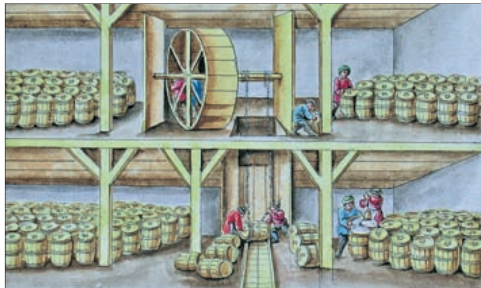
Franz A. von Waldauf, „Das inwendige des Salz Factoryey Stadl, allwo in den unteren Boden 4422 und in den oberen 5749 Kontrahenten Fässer aufbewahrt werden können.“

Rückwirkend mit Jahresbeginn 1757 wird im Stadt- und Landgericht Lienz für den täglichen Gebrauch und als Viehsalz oder wie auch immer es bezeichnet werde, für die Gegenwart und auch noch für die Nachkommen auf das ausländische Salz verzichtet, außer es werde von Seiten der Obrigkeit eine „Dispens“ erteilt. Man verpflichtet sich, das tirolisch-landesfürstliche Salz zu gebrauchen. In Anbetracht des weiten Lieferweges von Hall in die Herrschaft Lienz wird pro Fuder Salz in üblichem Maß und Gewicht ab dem Pfannhaus ein Preis von 4 fl. 12 kr. vereinbart. Dieses vergünstigte Salz durfte aber ausdrücklich nicht in den Gerichten westlich